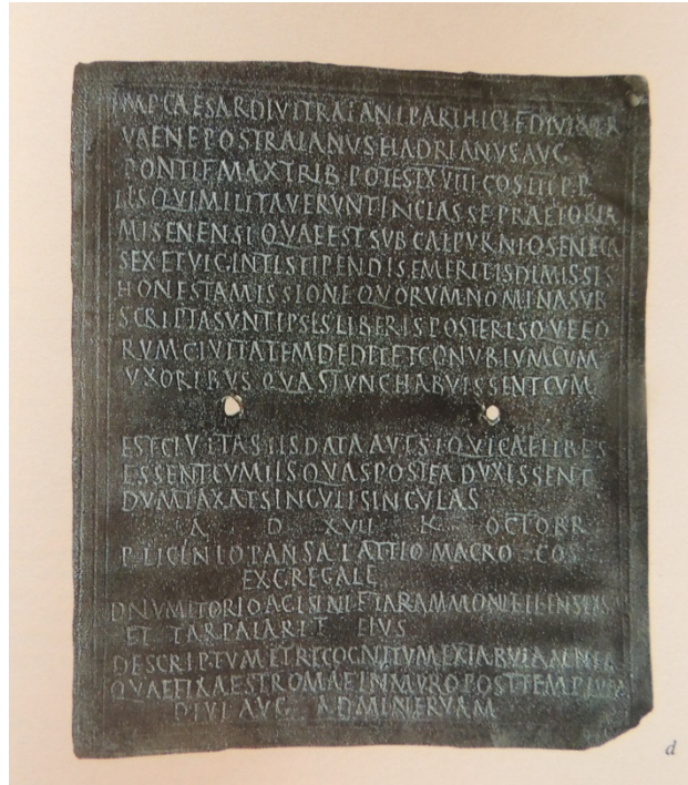
Fig. 4 - Esterno della tabella I (da AA.Vv. 1989, p. 231, fig. 16 d).

La parte esterna della tabella I ripete lo stesso testo presente nel suo lato interno e quello inciso nel lato interno della tabella II (fig. 4).