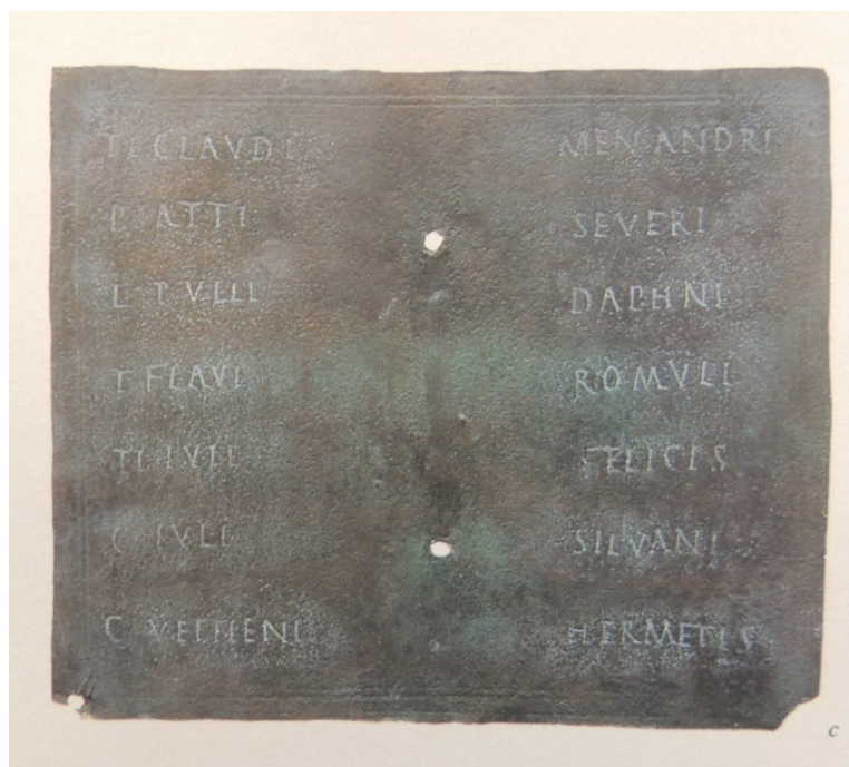
Fig. 3 - Esterno della tabella II con i nomi dei testimoni (da AA.Vv. 1989, p. 231, fig. 16 c).

Sul lato esterno della lamina di bronzo era riportato nuovamente tutto il testo del congedo e i nomi dei sette testimoni: Ti(beri) Claudi Menandi; P(ubli) Atti Severi; L(uci) Pulli Daphni; T(iti) Flavi Romuli; Ti(beri) Iuli Felicis; C(ai) Iuli Silvani; C(ai) Vettieni Hermetis (fig. 3).