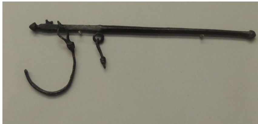
Fig. 2 - Stadera in bronzo conservata presso il Museo "A. Sanna" di Sassari