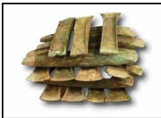
Fig. 2 - Nuraghe S'Ortali 'e su Monte. Il ripostiglio di 19 asce di bronzo ricomposto nella vetrina del museo.

È, inoltre, possibile ipotizzare l'esistenza di stretti rapporti e di scambi commerciali tra le popolazioni montane delle zone interne e le comunità che abitavano i territori costieri, come dimostrerebbe la presenza di asce tipologicamente simili nel centro metallurgico di S'Arcu 'e is Forros di Villagrande Strisaili (fig. 3) e, più a nord, nel nuraghe Sisine di Nule (fig. 4).