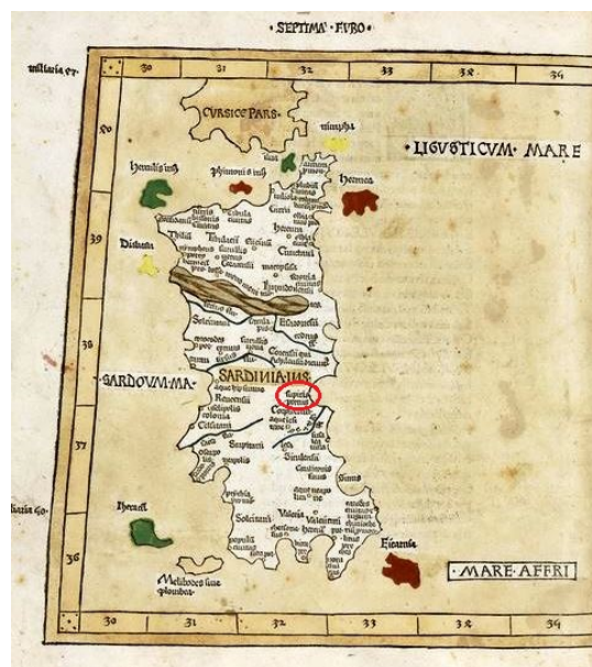
Fig. 4 - Septima Europe Tabula , in Ptolomeus Claudius, Cosmographia , Ulma, 1482. Nel cerchio rosso l'indicazione del Sulpicius Portus