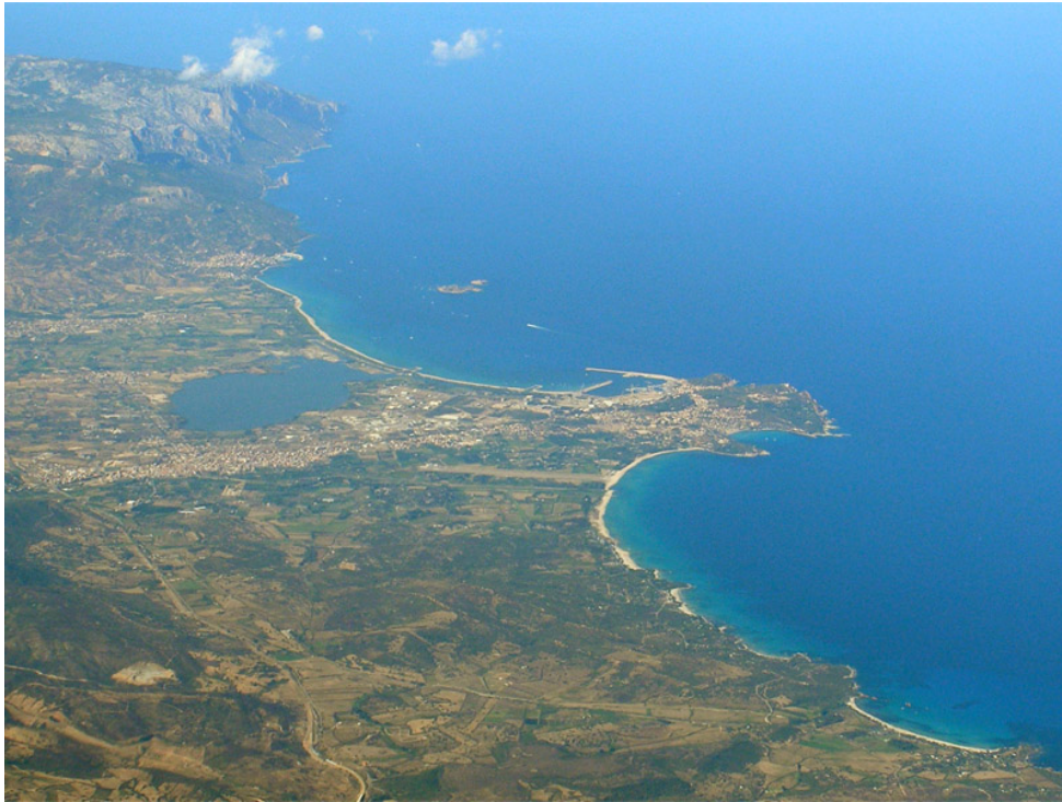
Fig. 2 - Foto aerea con veduta dello stagno di Tortoli.

Altre attestazioni della fase romana sono le strutture murarie riferibili ad ambienti termali presso la chiesa di Santa Barbara 9 e a San Lussorio 10 e i numerosi rinvenimenti sporadici di monete 11 , bolli su dolia 12 e ceramiche da mensa e da cucina. Inoltre, il recupero in mare di un cospicuo numero di anfore (fig. 3), testimonia l'esistenza di intensi traffici commerciali, specialmente di olio e pasta di pesce, tra la costa ogliastrina e gli altri paesi del Mediterraneo, in particolar modo col Nord Africa. Ciò è avvalorato anche dalla citazione riportata