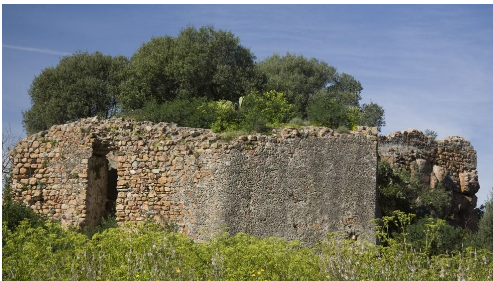
Fig. 4 - I ruderi del castello di Medusa, Lotzorai