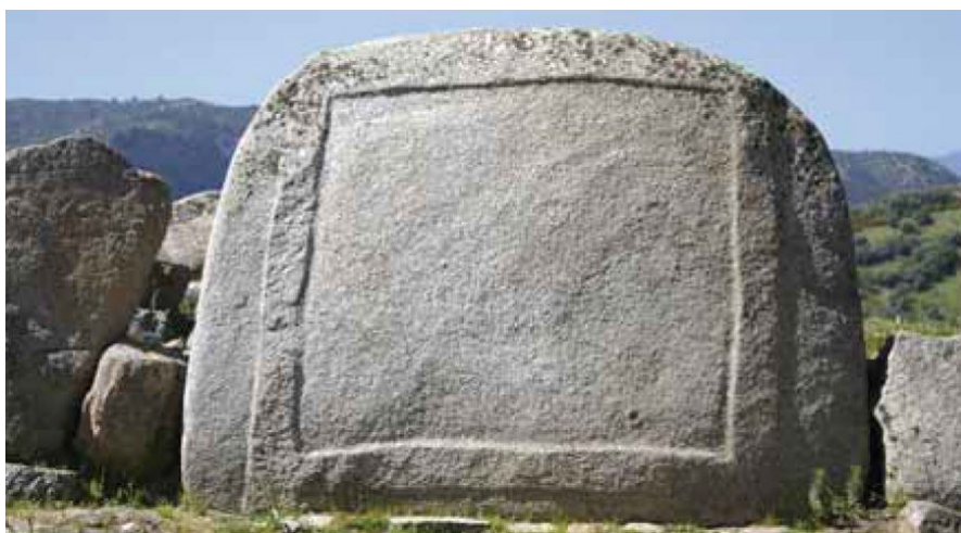
Fig. 3 - Parte inferiore della stele bilitica con cornice in rilievo (da FADDA 2012, p. 29, fig. 37).

La seconda sepoltura si trova alla base della collina di S'Ortali 'e Su Monte . È conosciuta come tomba di giganti di Pala Niedda e risulta attualmente all'interno di una proprietà privata. Lunga 12 metri, conserva un filare del paramento murario esterno costruito con blocchi di granito e un'esedra con ali leggermente arcuate. Non è ancora stata indagata dagli archeologi e la mancanza di resti di cultura materiale non consente di verificare se il monumento sia contemporaneo al nuraghe e all'altra tomba.