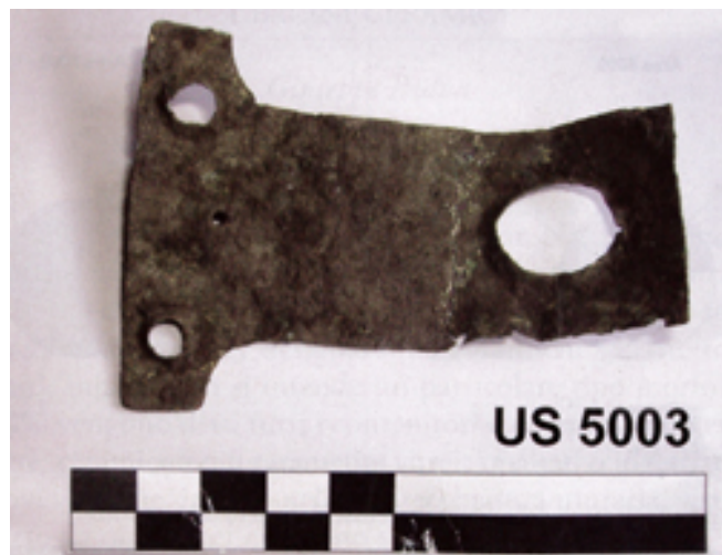
Fig. 3 - Elemento in bronzo di una cassetta lignea (foto del Comune di Semestene).