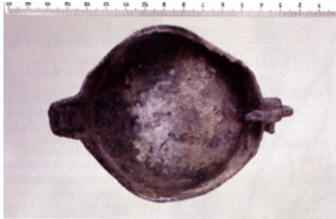
Fig. 5 - Lucerna (foto del Comune di Semestene).