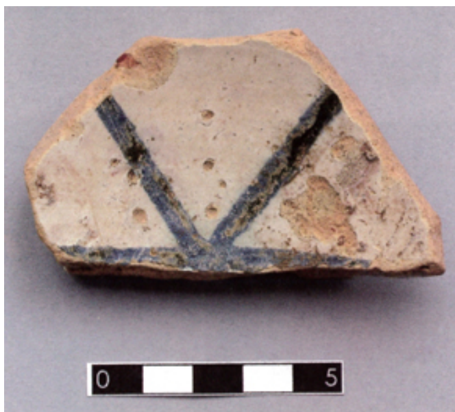
Fig. 3 - Smaltata spagnola blu e lustro.