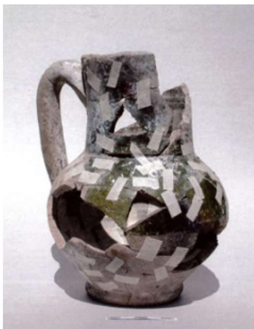
Fig. 7 - Obra verde de Barchinona, boccale.