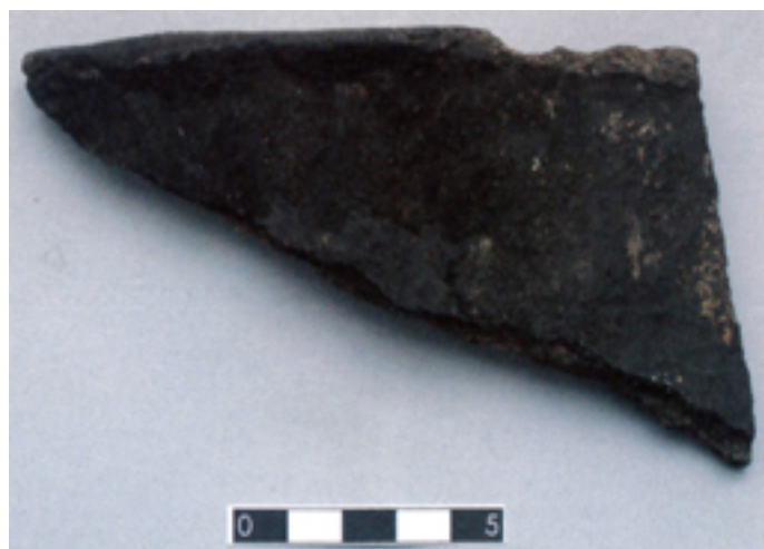
Fig. 1 - Tegame in ceramica acroma grezza.

I reperti ceramici rinvenuti nei pressi del complesso monastico di San Nicola di Trullas appartengono a tre diversi momenti di frequentazione del sito ed hanno, pertanto, fornito importanti informazioni sulle dinamiche di popolamento e abbandono dell'area nel corso del tempo. Le ceramiche prive di rivestimento "grezze" e depurate, le anfore iberiche, i manufatti invetriati, la maiolica arcaica pisana e la ceramica spagnola con decorazioni in blu e lustro, risalgono tutte al periodo medievale e precisamente alla metà del Trecento (figg. 1-8), ovvero all'ultimo periodo di vita del monastero, prima della sua distruzione causata da un incendio e del conseguente abbandono dell'area di San Nicola.