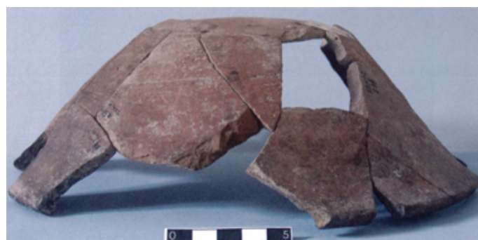
Fig. 2 - Testo da pane.