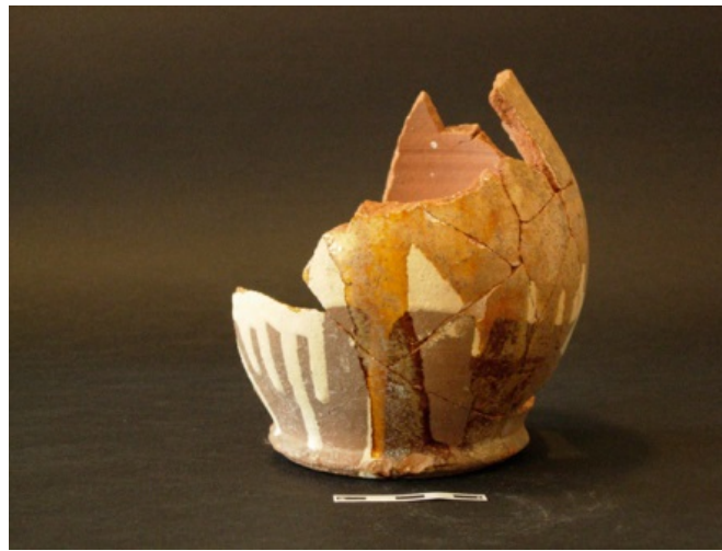
Fig. 9 - Boccale ingobbiato sardo.

con piede a disco color arancio (fig. 9); mentre le maioliche d'importazione provengono da Montelupo fiorentino, Savona o dall'area barcellonese (fig. 10).