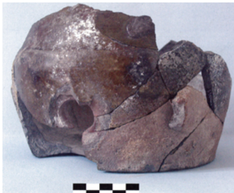
Fig. 6 - Fiasca invetriata sarda (foto del Comune di Semestene).