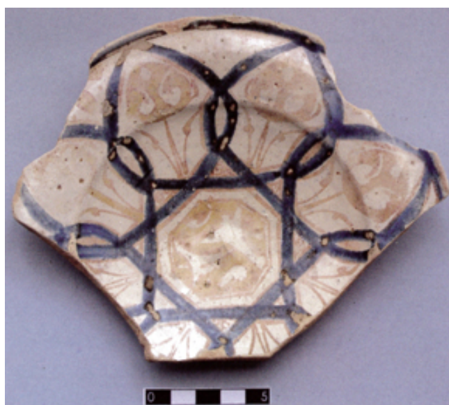
Fig. 4 - Smaltata spagnola blu e lustro.