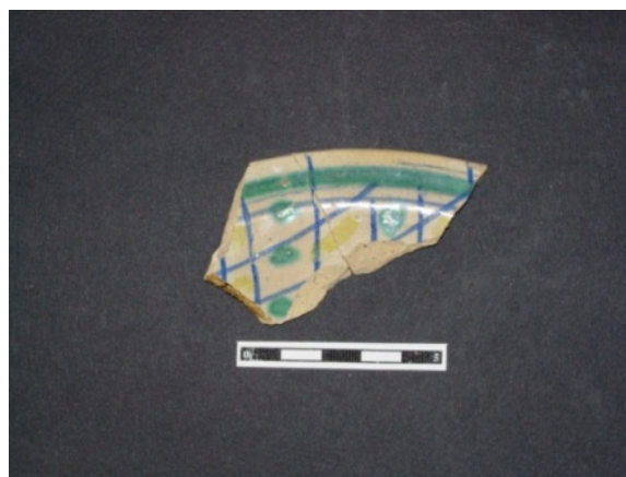
Fig. 10 - Maiolica policroma, Sassari.

Infine una frequentazione del sito in età moderna e contemporanea (metà XVIII - inizio XX secolo) risulta testimoniata da ceramiche a taches noires albisolese e siciliana, maioliche di fabbrica laziale con decorazioni in bruno e giallo e terraglia di produzione italiana.