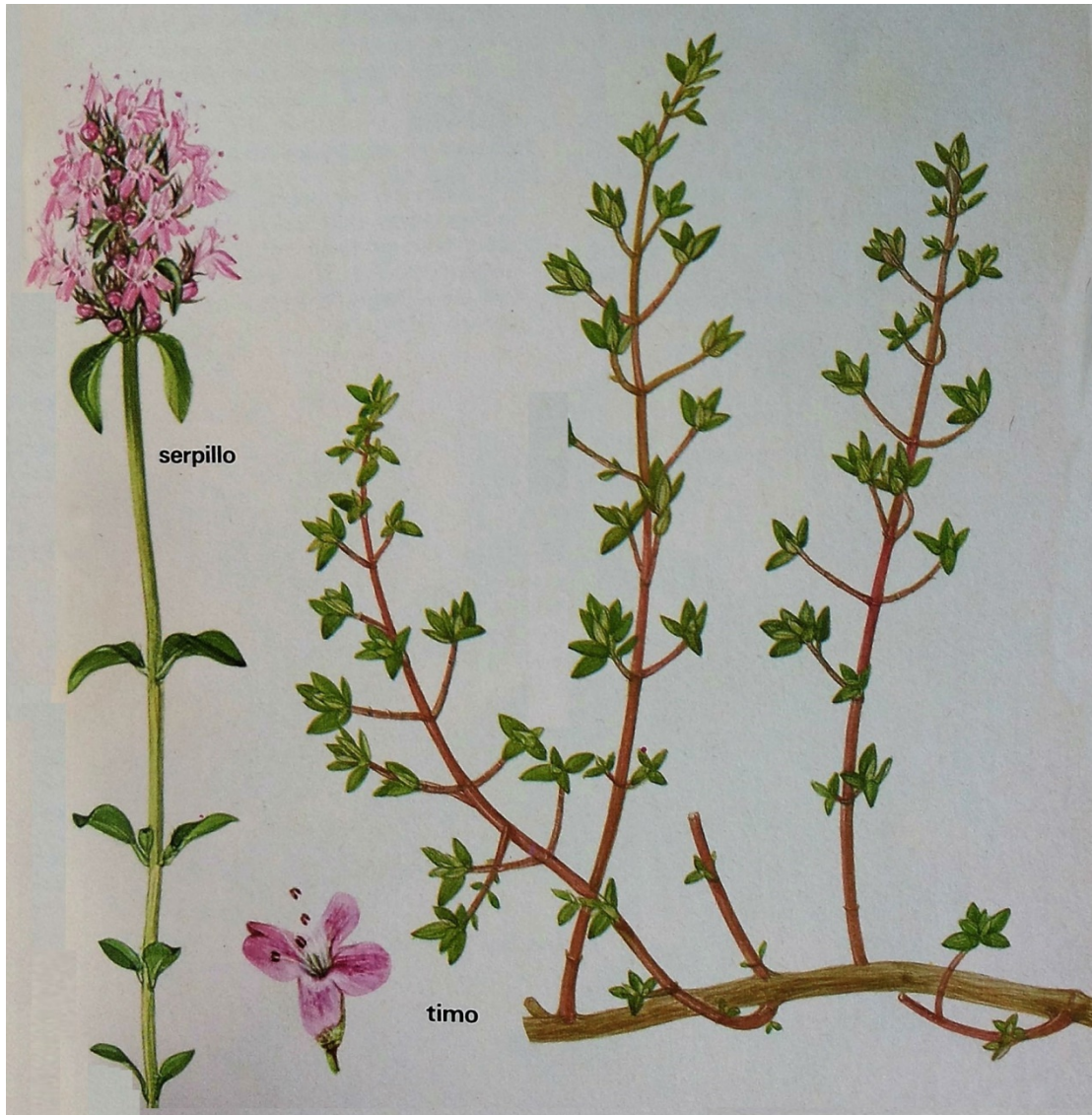
Fig. 1 - Serpillo e Timo (da Lanzara 1978, p. 195).