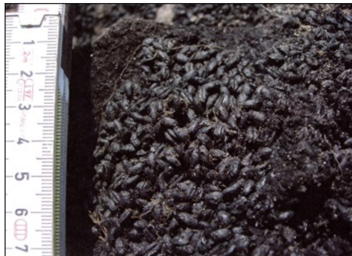
Fig. 3 - Accumuli di cereali combusti.