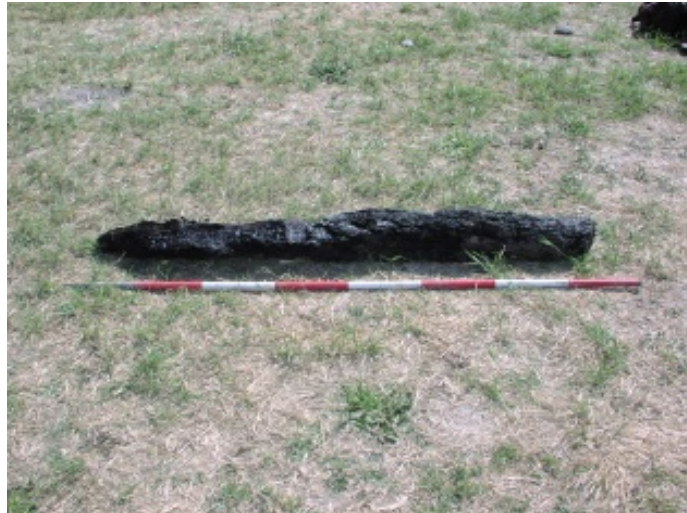
Fig. 2 - Frammenti di legno carbonizzato.