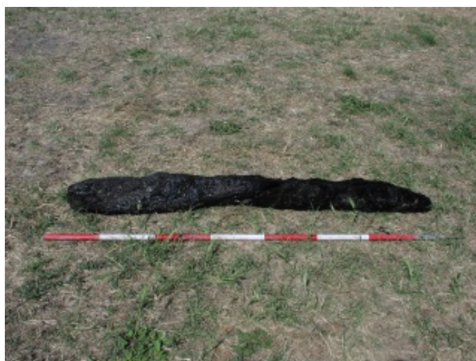
Fig. 1 - Frammenti di legno carbonizzato.

Il monastero di San Nicola di Trullas fu abbandonato a causa di un grave incendio verificatosi a metà del XIV secolo. Il rischio di incendi era piuttosto frequente per i monasteri del Medioevo, dal momento che l'unico modo per illuminare le stanze era l'uso di candele e la maggior parte degli arredi interni era realizzata in legno e tessuto, facilmente infiammabili. Il fuoco non si limitò a consumare il monastero dall'interno, ma ne danneggiò irrimediabilmente le murature, portando anche al crollo del tetto. Gli archeologi hanno individuato tracce di combustione su molti tra gli oggetti e gli elementi architettonici antichi, recuperati nel corso degli scavi, sopravvissuti fino ad oggi quasi come una "fotografia istantanea" del drammatico episodio (figg. 1-4).