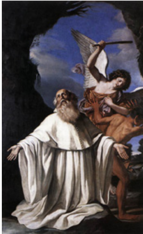
Fig. 5 - Guercino, San Romualdo, 1640-41 ( http://it.wikipedia.org/wiki/File:Guercino_san_Romualdo.jpg ).