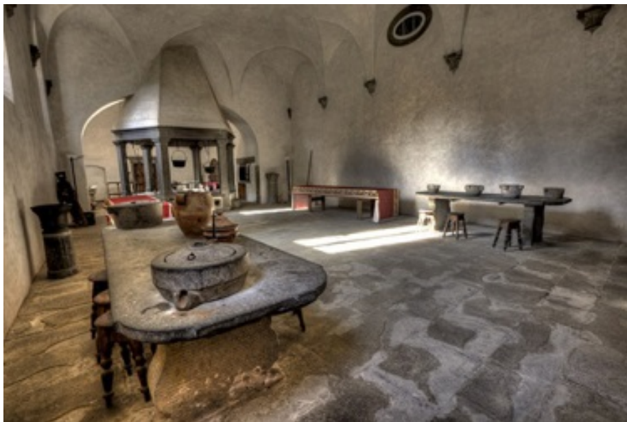
Fig. 1 - Cucina di Vallombrosa ( https://www.flickr.com/photos/pinomoscato/sets/72157626426353731/detail/ ).

I monaci camaldolesi, in osservanza alla regola benedettina, si distinguono per l'accentuata capacità organizzativa, per l'importanza data alla preghiera canonica, per l'obbligo della residenza del monaco nel monastero, ma specialmente per il riconoscimento dell'importanza del lavoro sia manuale (lavoro agricolo) sia intellettuale (studio, trascrizione di codici; figg. 1-5).