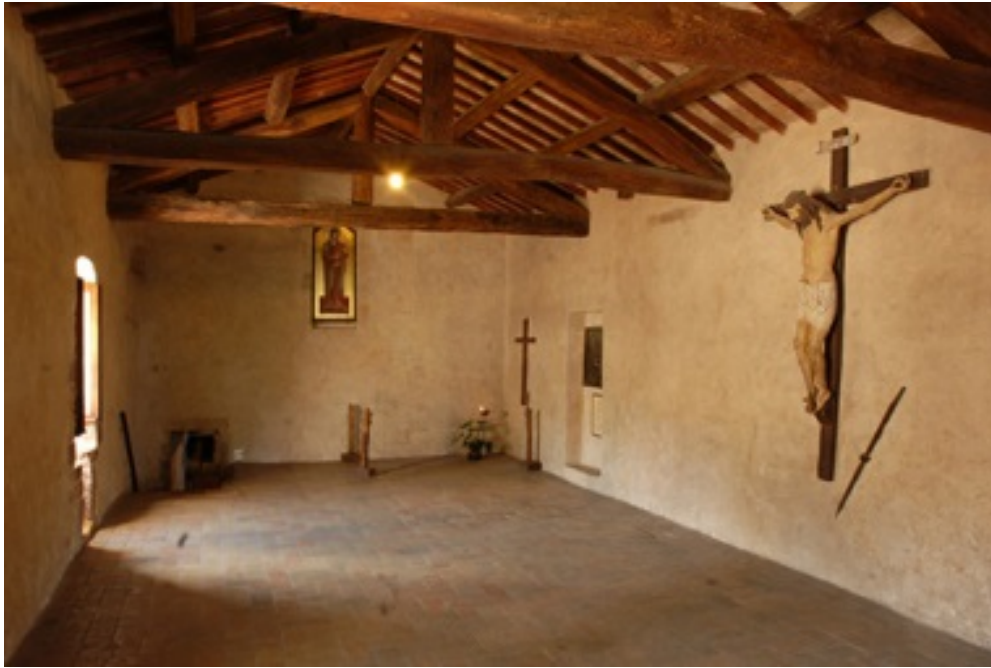
Fig. 2 - Dormitorio di San Damiano, Assisi.

Tuttora i monaci camaldolesi cercano di dedicare quotidianamente un opportuno tempo a ciò che nutre le dimensioni fondamentali della vita dalla preghiera, al riposo, al tempo libero.