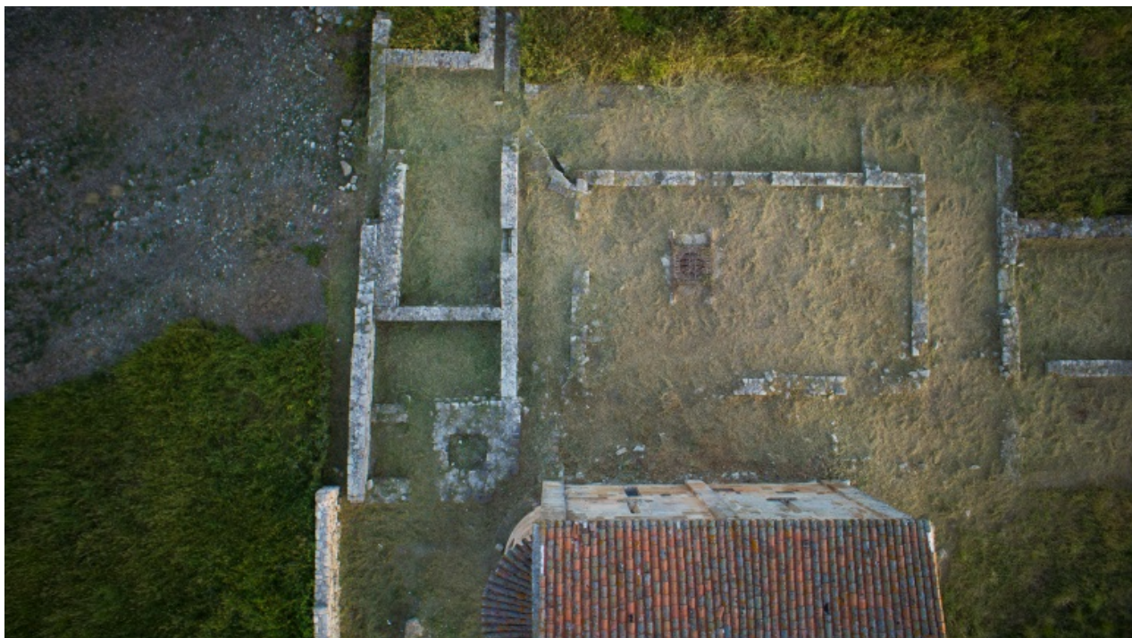
Fig. 1 - I resti del chiostro e del pozzo del monastero visti dall'alto.

All'interno dei monasteri il pozzo era fondamentale, non solo per attingere l'acqua ma anche per preparare i pasti dei monaci, curare l'igiene, coltivare gli orti e realizzare oggetti, come il vasellame (fig. 1).