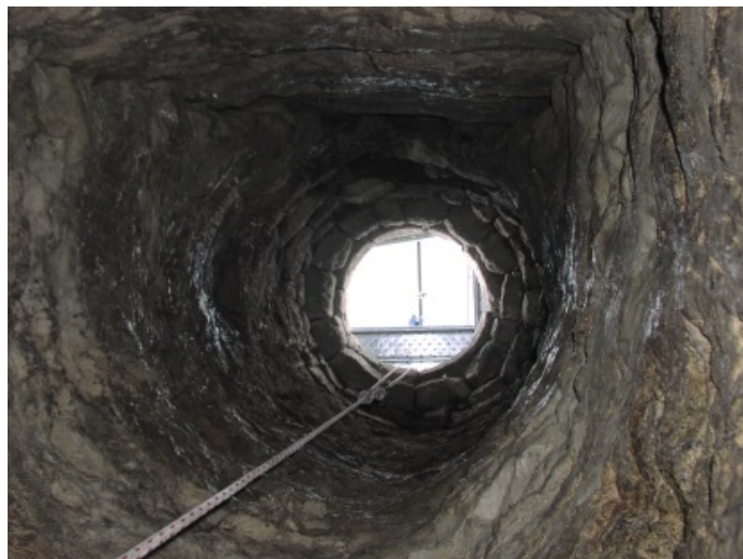
Fig. 3 - L'interno del pozzo.

I materiali provenienti dagli strati di riempimento del pozzo non possono essere interpretati solo come resti di pasto (fig. 3). Sono stati trovati, infatti, anche numerosi frammenti ossei recanti segni di macellazione, e una gran quantità di ossa intere, teste ed ossa lunghe appartenenti a bovini adulti.