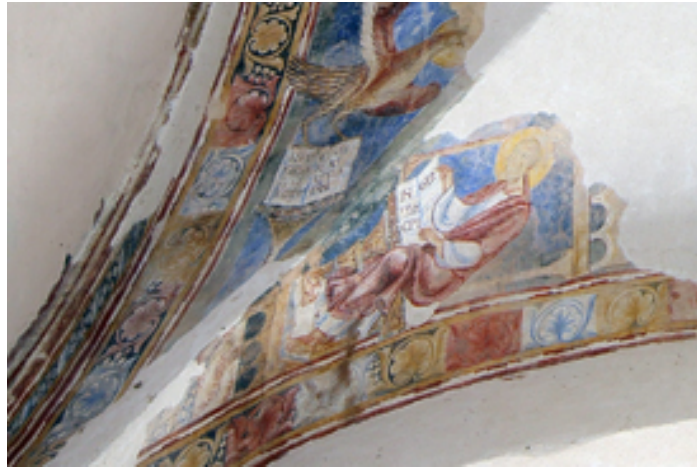
Fig. 4 - Volta est: l'Evangelista Giovanni.