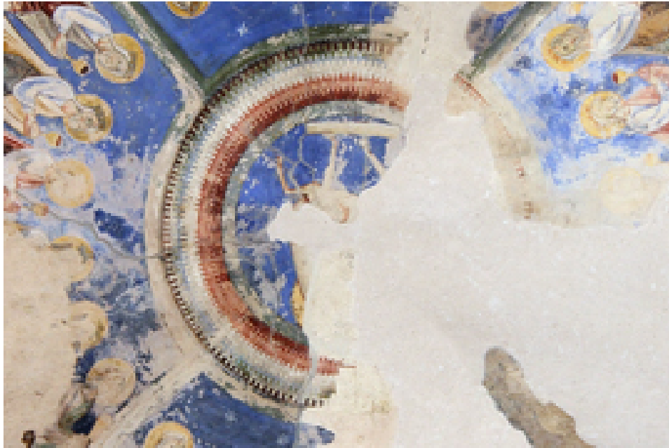
Fig. 2 - Volta est: clipeo centrale.