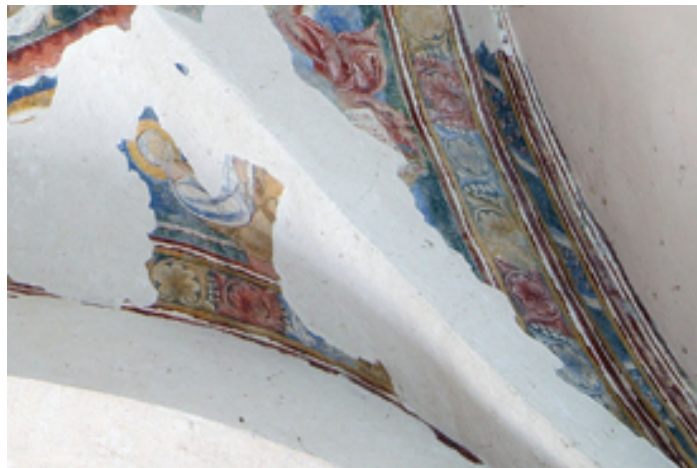
Fig. 5 - Volta est: figura di Evangelista.