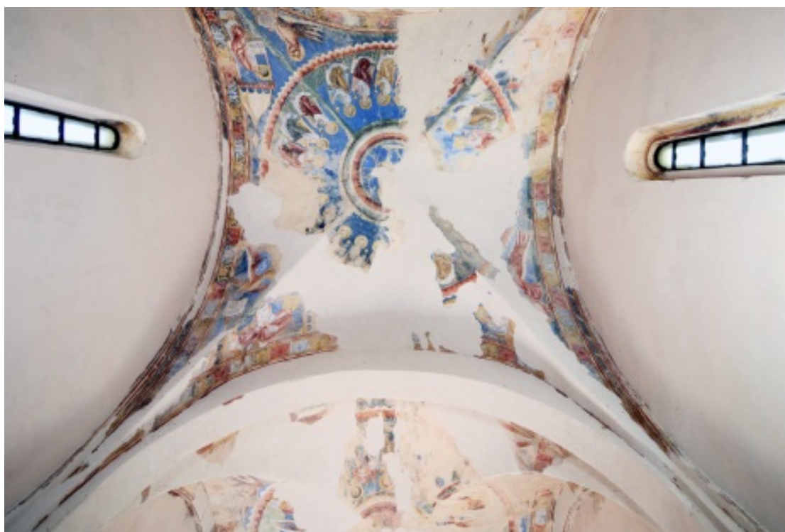
Fig. 1 - Volta est: adorazione dell' Agnus Dei.

Nella volta orientale è raffigurata l'adorazione dell' Agnus Dei da parte dei ventiquattro Vegliardi, come descritta nel libro dell'Apocalisse (fig. 1); i Vegliardi sono disposti in processione circolare attorno al clipeo centrale con l'Agnello mistico attorno al quale è dipinta una fascia colorata su cui corre la scritta in lettere dorate Virginis partus (fig. 2). Al di fuori della composizione circolare, lungo le quattro unghie delle vele, sono raffigurati i quattro Evangelisti seduti e affrontati al rispettivo simbolo, ritratti nell'atto di scrivere il proprio Vangelo (figg. 3-6).