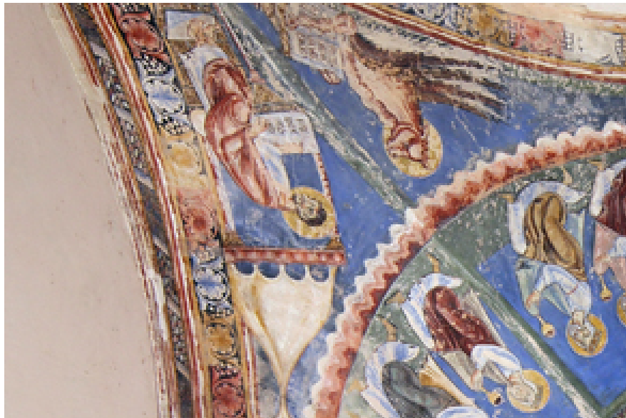
Fig. 3 - Volta est: l'Evangelista Luca.