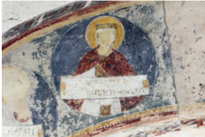
Fig. 2 - Gli affreschi dell'arco absidale: figura di un profeta (foto di Unicity S.p.A.).