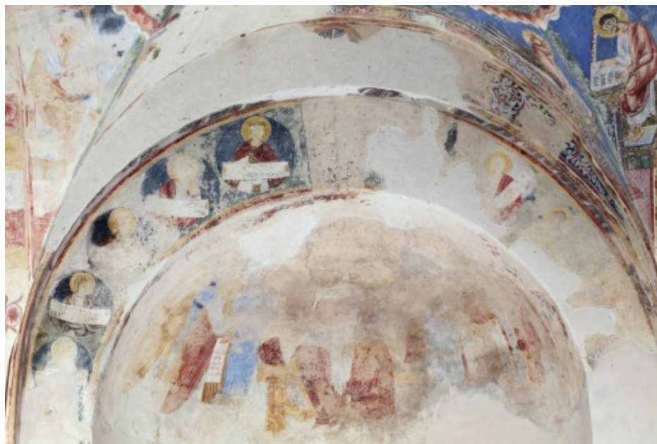
Fig. 1 - Gli affreschi dell'arco absidale.

L'arco absidale (fig. 1) presenta una serie di tondi contenenti figure di profeti che reggono in mano dei cartigli con iscrizioni tratte dai loro libri, oggi solo parzialmente ricostruibili (figg. 2-3). Erano in tutto in numero di dodici, divisi in due gruppi di sei ai lati di un clipeo centrale (fig. 4), la cui figurazione oggi non è più leggibile.