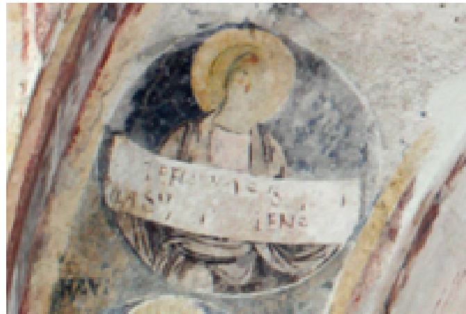
Fig. 3 - Gli affreschi dell'arco absidale: figura di un profeta.