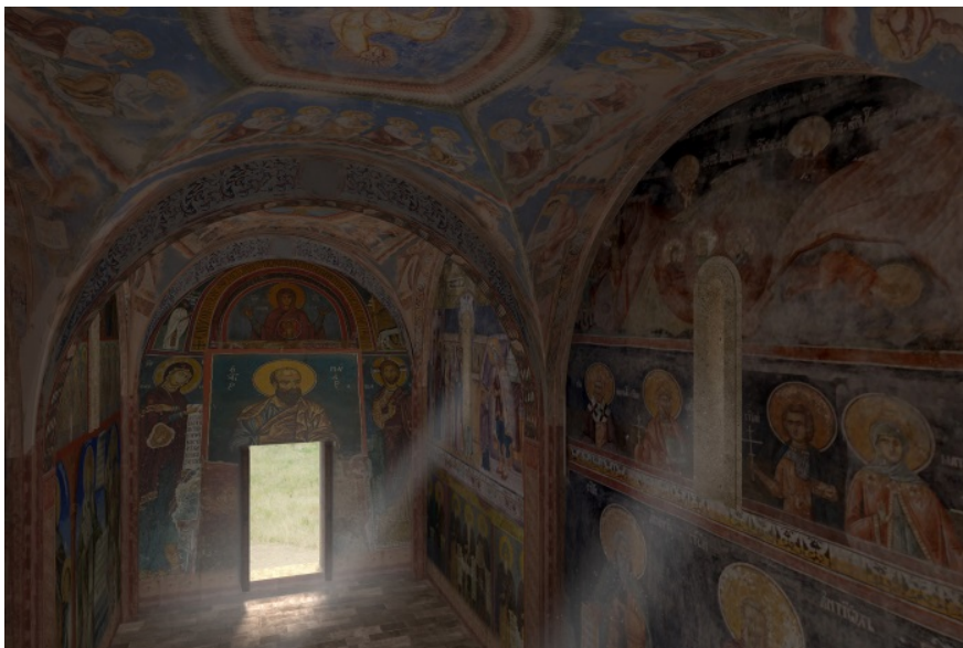
Fig. 5 - Ipotesi di ricostruzione dell'interno della chiesa di S. Nicola di Trullas (visual di Unicity S.p.A.).