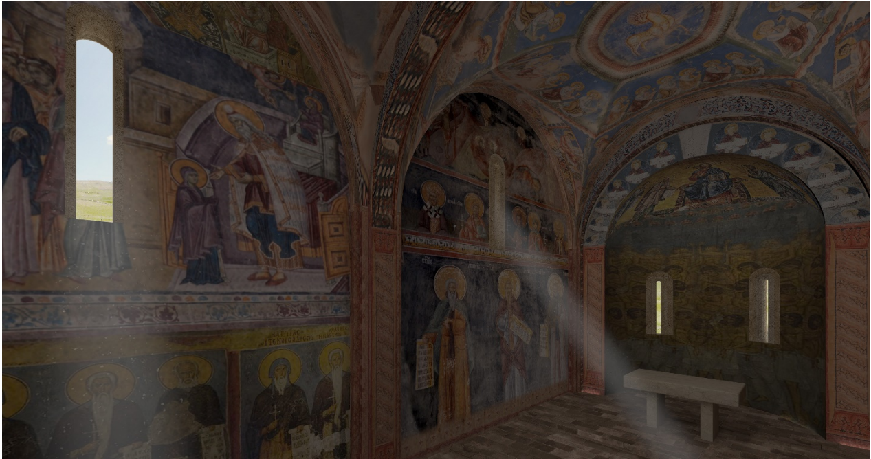
Fig. 4 - Ipotesi di ricostruzione dell'interno della chiesa di S. Nicola di Trullas (visual di Unicity S.p.A.).

Probabilmente in origine la decorazione pittorica doveva interessare tutta la superficie muraria interna della chiesa, come era consuetudine nelle fabbriche medievali (figg. 4-5).