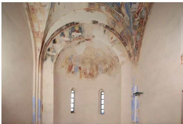
Fig. 2 - L'abside della chiesa di S. Nicola di Trullas.

L'abside, la superficie delle due volte a crociera, le pareti laterali e la controfacciata conservano ancora tracce della decorazione a fresco, emerse in occasione dei lavori di restauro effettuati nel 1997, a seguito della rimozione degli intonaci che li celavano (fig. 3).