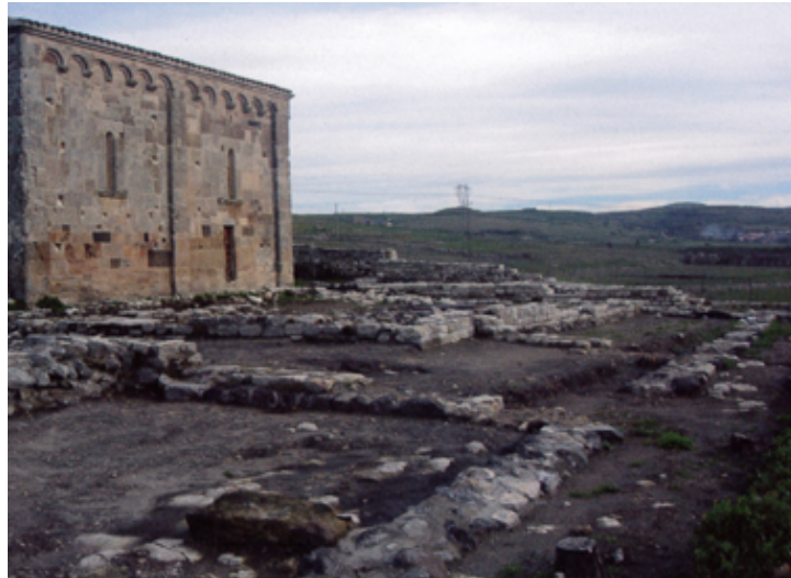
Fig. 2 - Gli scavi del monastero lungo il fianco sud.

Le prime indagini si sono concentrate nel settore presso l'abside e hanno messo in luce alcune strutture che conservavano ancora un deposito stratigrafico intonso, testimonianza della fase finale della vita nel monastero. Le indagini successive, che hanno ampliato verso ovest l'area interessata dagli scavi, hanno riportato in luce il complesso monastico costituito da un chiostro con cortile e pozzo centrale e un deambulatorio rettangolare coperto, sul quale si affacciano diversi ambienti (figg. 3-4). Gli scavi hanno consentito di indagare circa dieci ulteriori ambienti relativi al complesso monastico e di studiarne la sequenza stratigrafica, consentendo di documentare le ultime fasi di vita del monastero, distrutto in seguito ad un grande incendio verificatosi attorno alla prima metà del XIV secolo, che causò poi anche l'abbandono del sito, oggetto poi di una rifrequentazione nel corso del XVI e XVII secolo.