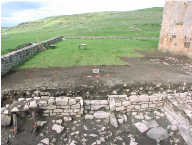
Fig. 5 - Gli scavi lungo il fianco sud della chiesa.

Importanti per la ricostruzione della vita nel monastero nella fase di rifrequentazione cinque-seicentesca sono i materiali rinvenuti nel pozzo, utilizzato come discarica e riempito in una fase successiva all'incendio, con i materiali crollati del chiostro e degli edifici circostanti (figg. 5-6).