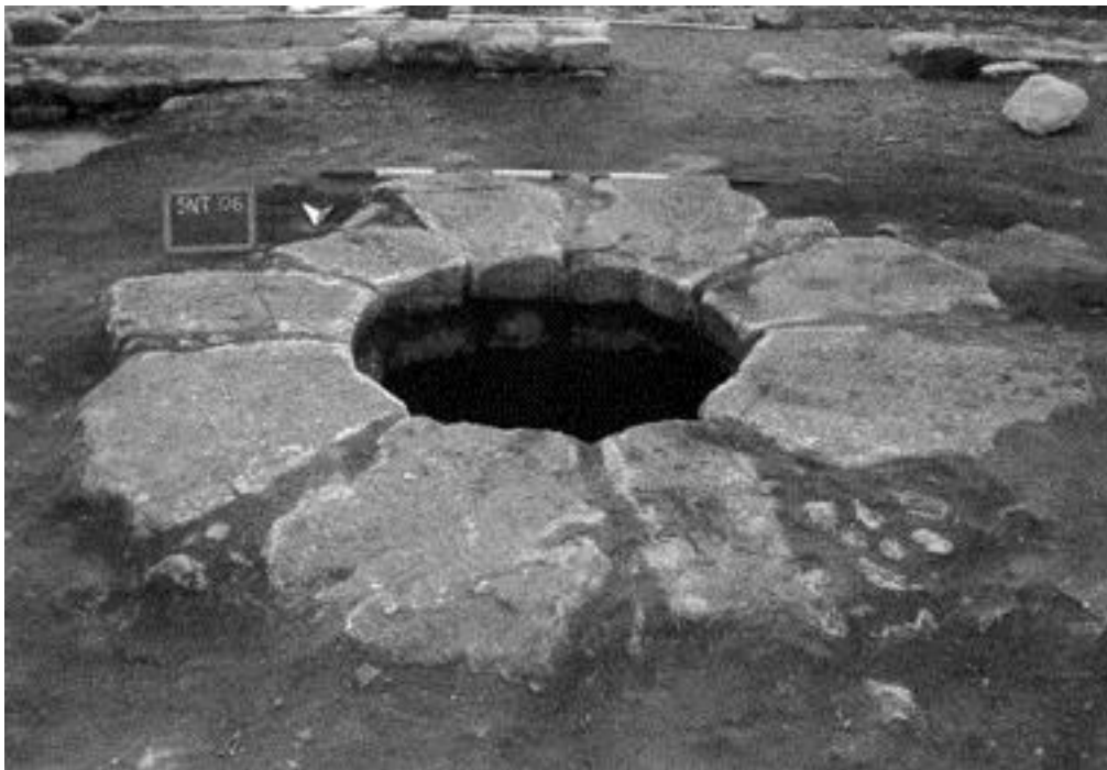
Fig. 4 - La ghiera del pozzo nel cortile del chiostro.