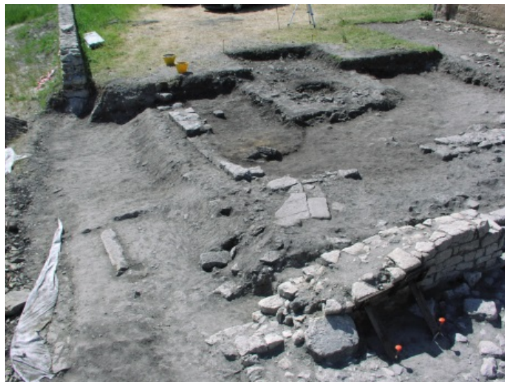
Fig. 6 - Gli scavi lungo il fianco sud della chiesa (foto del Comune di Semestene).