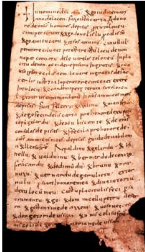
Fig. 1 - Privilegio Logudorese: pergamena.

Il fondo Diplomatico Coletti dell'Archivio di Stato di Pisa 1 custodisce un importante documento, considerato la più antica testimonianza scritta in lingua sarda 2 : il cosiddetto Privilegio logudorese (fig. 1).