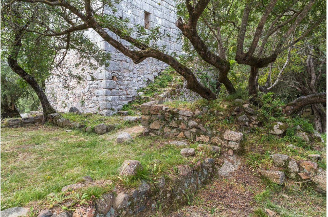
Fig. 2 - Torre e ambiente gamma, veduta da Est.

e punteruoli in ferro, mentre dal secondo (fig. 2) - caratterizzato da un accesso che conduceva alla corte centrale e da un altro messo in relazione con l'esterno del complesso - provengono staffe e altri finimenti per i cavalli (fig. 3) 1 .