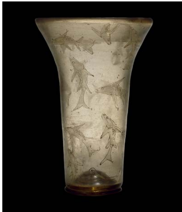
Fig. 4 - Londra, British Museum: bicchiere in vetro con decorazione smaltata in rosso e oro di produzione egiziana (da http://www.britishmuseum.org/explore/highlights/highlight_image.aspx?image=ps230209.jpg&retpage=18750 ).

Allo stato attuale della ricerca, il mancato riconoscimento della forma di tali reperti ha comportato la necessità di trovare analogie con manufatti vitrei arabi: in altre regioni italiane sono stati rinvenuti coppe e bicchieri duecenteschi che riportano formule beneauguranti islamiche smaltate e motivi decorativi che sembrano far propendere per una somiglianza con quelli rinvenuti nel Palazzo di Luogosanto, mentre invece lampade da moschea e contenitori smaltati siro-egiziani, in cui compaiono testi in caratteri arabi databili tra il XIII e il XV secolo, sono esposti in vari musei europei e statunitensi (figg. 4-5) 5 .