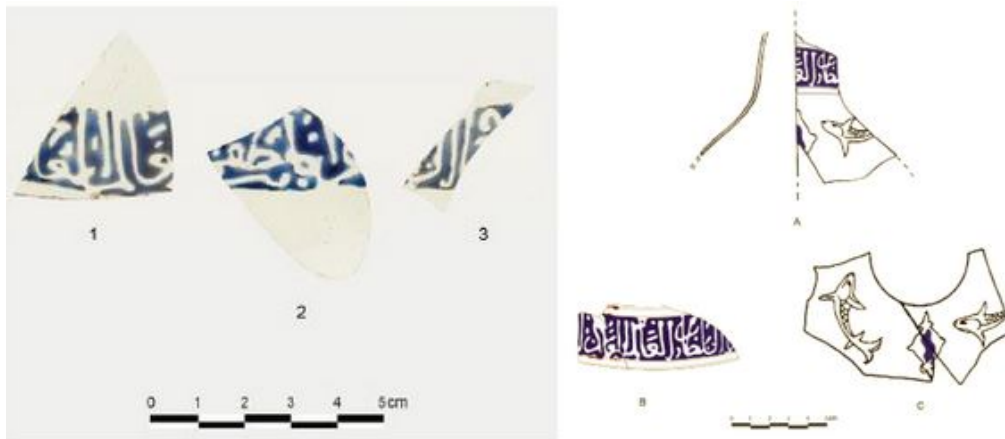
Fig. 1 - Luogosanto, Palazzo di Baldu: rappresentazione grafica dei frammenti rinvenuti (da PINNA, MUSIO 2012, p. 322, figg. 10-11).

Durante le campagne di scavo condotte negli anni 2001 e 2002, all'interno dei tre vani ( \eta , \theta , \iota ) ubicati a Sud del Palazzo di Baldu 1 sono stati rinvenuti alcuni frammenti vitrei riconducibili a lampade islamiche 2 di produzione siriana o egiziana (fig. 1) 3 .