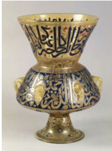
Fig. 5 - Berlino, Museo d'Arte Islamica, Pergamon Museum: lampada da moschea.

Tutti i manufatti riferibili a tale ambito sono stati interpretati come produzioni di nicchia create per soddisfare le esigenze delle classi sociali più elevate 6 .