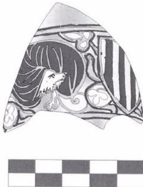
Fig. 4 - Sardara, Castello di Monreale: riproduzione grafica del frammento vitreo con lo stemma dell'Aragona (da SANTINI 2012, p. 308, Tav. 5).

Per la loro raffinatezza, tali manufatti vitrei possono essere considerati una produzione sontuaria, che viene attestata in Sardegna solamente nel Palazzo di Baldu e nel castello di Monreale (fig. 4) 6 .