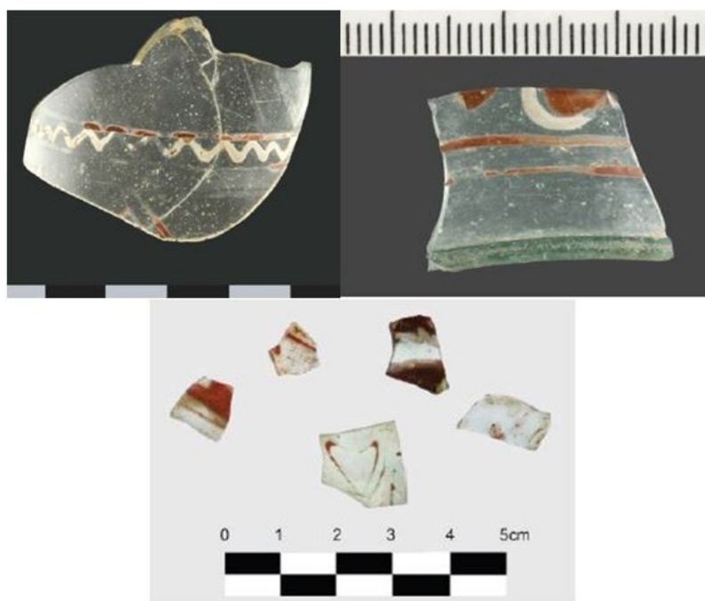
Fig. 1 - Luogosanto, Palazzo di Baldu: frammenti rinvenuti nei vani \eta , \theta , \iota (da PINNA, MUSIO 2012, pp. 322-323, figg. 14, 16-17).

I frammenti - quattro dei quali, ricomposti, hanno costituito una porzione cilindrica di un esemplare - sono caratterizzati da decorazioni smaltate con motivi diversi, come due linee parallele rosse separate da una linea ondulata di colore bianco e raffigurazioni vegetali (fig. 1); mentre un fondo è privo di decorazione, seppur riferibile alla stessa classe per forma e dimensioni (fig. 2) 2 .