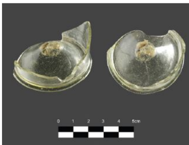
Fig. 2 - Luogosanto, Palazzo di Baldu: frammento di fondo privo di decorazione (da PINNA, MUSIO 2012, p. 324, fig. 18).

Questo gruppo di manufatti prende il nome dal mastro vetraio che firmò con l'iscrizione " Magister Aldrevandin me fecit " un bicchiere attualmente conservato al British Museum di Londra (fig. 3). Tale esemplare è decorato con stemmi araldici ed elementi floreali eseguiti con smalti decorati, gli altri bicchieri facenti parte del gruppo mostrano invece soggetti religiosi, araldici, animali, talvolta accompagnati da iscrizioni latine con il nome dell'autore 3 .