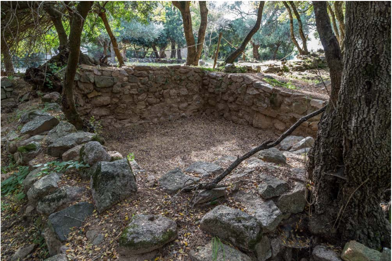
Fig. 2 - Luogosanto, Palazzo di Baldu: il vano v, indagato nella campagna di scavo 2014.

con malta di fango a chiudere uno spazio centrale riempito con elementi litici di pezzatura minore. Si nota evidentemente la disposizione a filari regolari dei massi in granito, che dimostra la perizia impressa in queste strutture da una mano esperta (fig. 2).