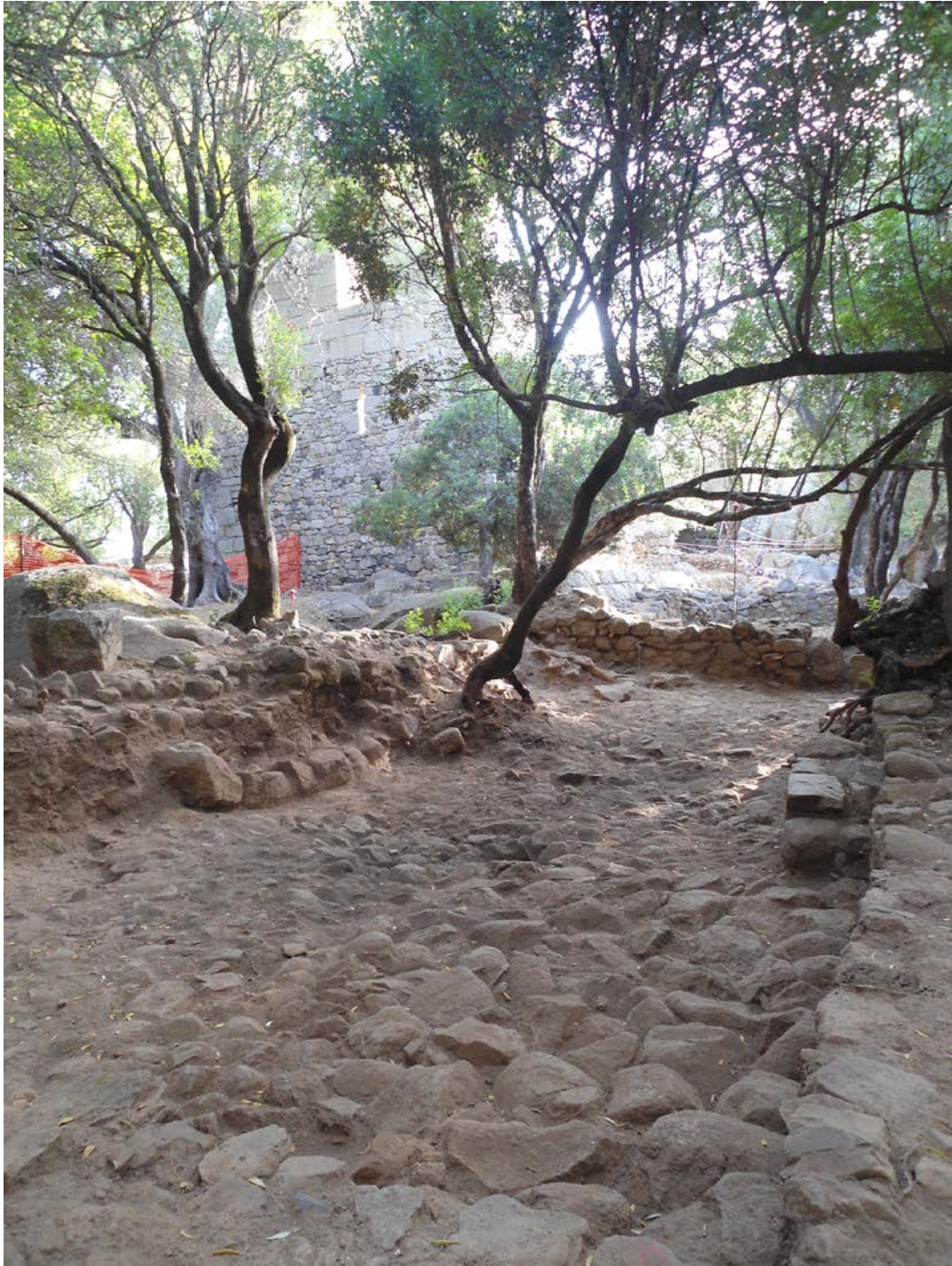
Fig. 3 - Luogosanto, Palazzo di Baldu: lu pamentu rinvenuto nel vano κ durante le indagini archeologiche.

gli stazzi locali. Analoga tecnica pavimentale costituita dal battuto di malta di fango regolarizzato, allisciato e lasciato indurire, si riscontra nella Sardegna meridionale con la variante del nome Su Pamentu .