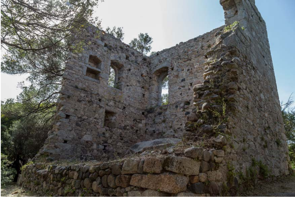
Fig. 2 - Luogosanto, Palazzo di Baldu: veduta da Sud-Est.

Il pianterreno, che ingloba un grosso masso granitico, è provvisto di piccole aperture orientate verso il cortile, forse per garantire l'aerazione del locale ipotizzato quale magazzino. Il primo piano riceveva aria e luce da feritoie mentre il secondo dalle monofore arcuate (fig. 2).