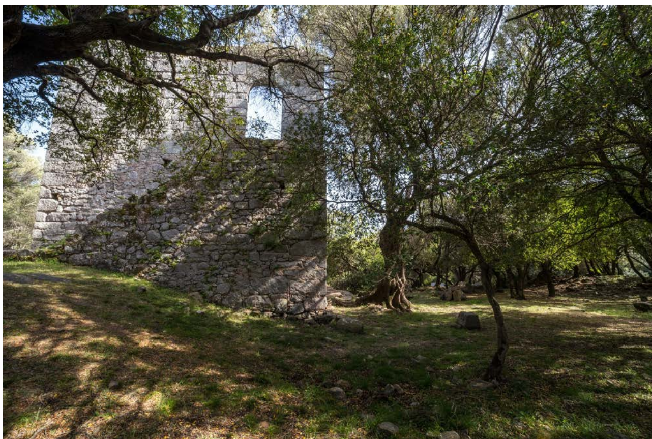
Fig. 1 - Luogosanto, Palazzo di Baldu.

Ubaldo II Visconti è il personaggio storico che la tradizione avvicina maggiormente al Palazzo ubicato nel territorio di Luogosanto, dal quale prenderebbe il nome: egli aveva la sua dimora ufficiale nel palazzo giudiciale di Civita (attuale Olbia), mentre i castelli di Baldu (fig. 1), di Balaiana e di Monteacuto erano le sue residenze estive 1 .