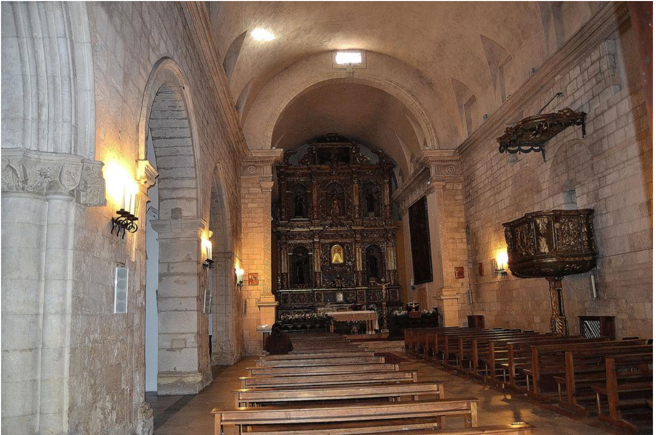
Fig. 4 - Sassari, chiesa di San Pietro di Silki: interno.