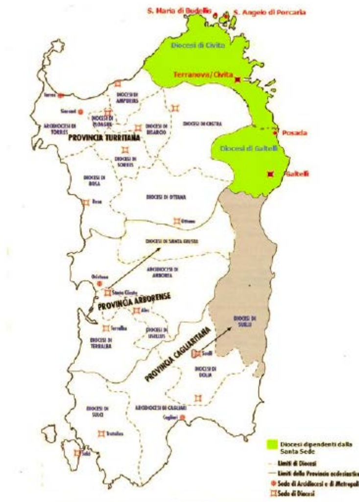
Fig. 1 - Suddivisione in diocesi della Sardegna medioevale (da TURTAS 1999, p. 968).

Dal XII al XVI secolo, il territorio della diocesi di Civita si estendeva nella parte settentrionale del giudicato di Gallura, che nel confine meridionale comprendeva come ultima curatoria, quella di Fundi de Monte, lasciando Posada alla diocesi di Galtellì (fig. 1) 1 . Il nome della diocesi corrisponde a quello della curatoria gallurese e della villa di Civita 2 .