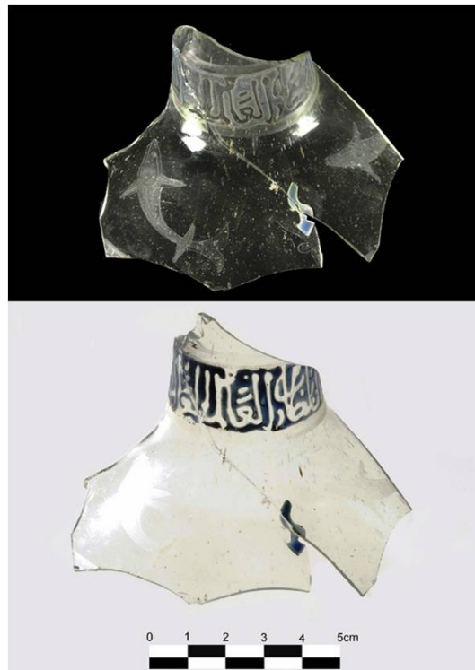
Fig. 3 - Frammento di lampada islamica con iscrizione smaltata e decorazioni graffite.

La produzione vitrea si diffondeva attraverso i medesimi circuiti della ceramica: provenienti dall'Oriente sono i frammenti dei manufatti vitrei smaltati decorati a motivi calligrafici arabi realizzati in smalto blu, alcuni dei quali con decorazione incisa (fig. 3), databili intorno al XIII secolo; infine contenitori vitrei smaltati e dorati con decorazioni epigrafiche in arabo di produzione siriana ed egiziana, compresa tra i secoli XIII e XV. Dalla penisola, invece, provengono manufatti toscani del XII-XV secolo e da Venezia vetri rientranti nel gruppo "Aldrevandin" relativi all'arco cronologico compreso tra XIII e XIV secolo 9 .