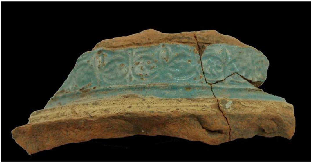
Fig. 2 - Frammento di giara con decorazione impressa a fasce e smalto turchese.

All'interno dell'area archeologica sono stati messi in luce frammenti di maiolica arcaica pisana (XIII-XIV secolo) e ceramica pisana non rivestita, le cui classi venivano esportate dalla Toscana durante gli stessi viaggi per il trasporto extraregionale 4 ; al XIV secolo si ascrivono le produzioni iberiche (valenzane e catalane) e la maiolica savonese della metà del medesimo secolo 5 . Le rotte dei mercanti pisani e genovesi lasciavano costantemente il Mediterraneo per raggiungere le terre islamiche dove commerciavano i propri manufatti con prodotti locali; tali merci potevano essere veicolate anche attraverso le coste iberiche e quelle africane 6 . Si tratta di giare con decorazioni impresse a fasce, probabilmente prodotte nel XIII secolo in Marocco e nella Spagna meridionale (fig. 2) 7 .