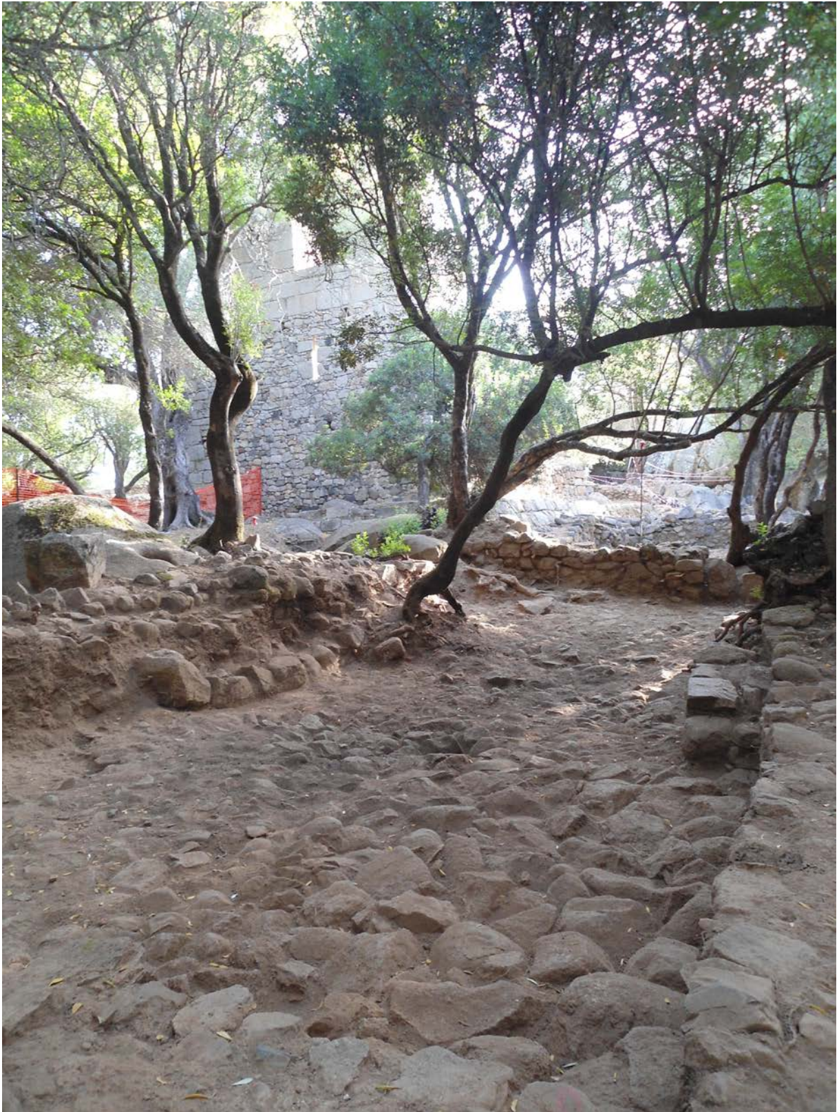
Fig. 2 - Palazzo di Baldu, vano κ: lu pamentu durante le indagini archeologiche.