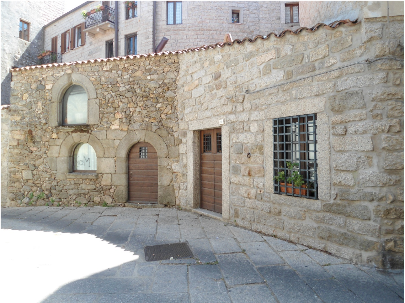
Fig. 2 - Tempio: la cosiddetta casa di Nino di Gallura.

Alla sua morte nel 1296, la carica di giudicessa di Gallura passò alla figlia Giovanna nonostante la fine dei domini viscontei in Toscana e Sardegna fosse ormai giunta: nel 1339 i suoi diritti passarono ai Visconti di Milano 8 .