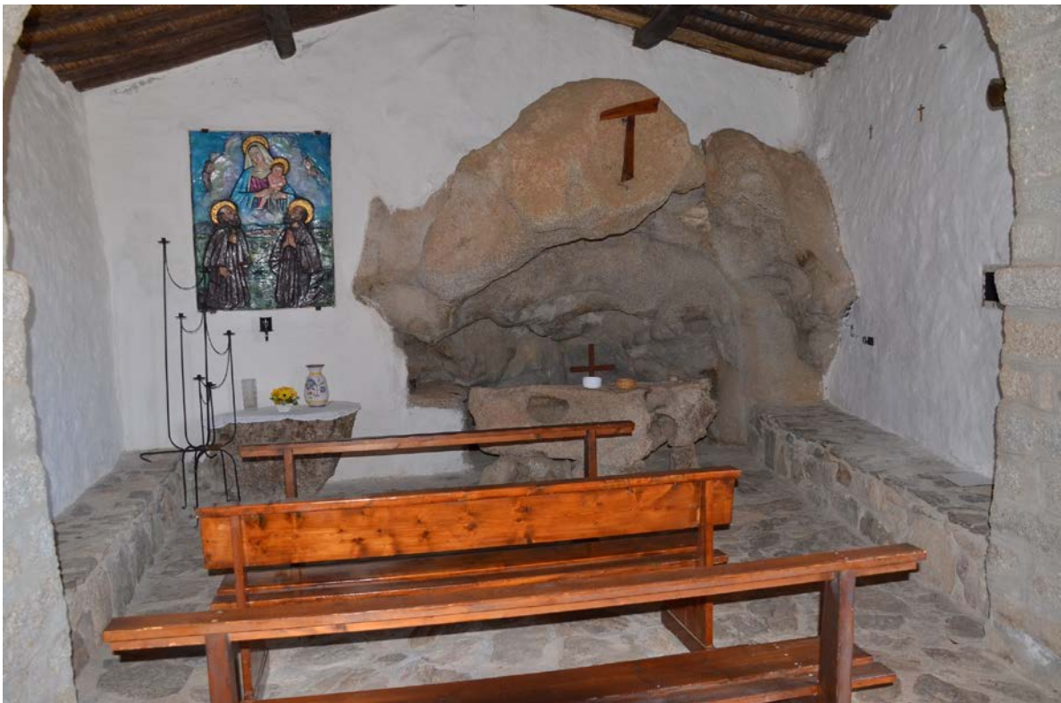
Fig. 3 - Eremo di San Trano: interno.

vennero incaricati di rinvenire i resti degli eremiti Nicola e Trano in Sardegna, nel luogo chiamato Cabosoprano, e di edificare nei pressi di questo luogo, tre chiese dedicate ai due eremiti e alla Vergine. I frati nel 1227 con l'aiuto del giudice Ubaldo Visconti, portarono a termine il proprio compito: una fu eretta sulla grotta dove furono rinvenuti i corpi (fig. 3), la seconda in Località Lu Rotareddu 8 mentre la terza accolse le reliquie degli eremiti sotto l'altare maggiore.