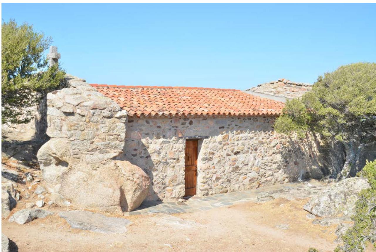
Fig. 1 - Luogosanto, chiesa di San Trano (foto di Unicity S.p.A.).

L'eremo dei Santi Nicola e Trano è ubicato su un affioramento granitico non distante dal paese di Luogosanto, a 2,5 Km dal Palazzo di Baldu: la chiesa sfrutta la roccia naturale nelle fondazioni e nei lati Est ed Ovest (fig. 1) 1 , ed internamente utilizza un affioramento di granito nero come altare. Inoltre, all'interno dell'aula rettangolare è inglobato l'anfratto dove sarebbero stati rinvenuti i corpi dei Santi 2 . L'ingresso avviene tramite due porte collocate rispettivamente sui lati lunghi (fig. 2) 3 .