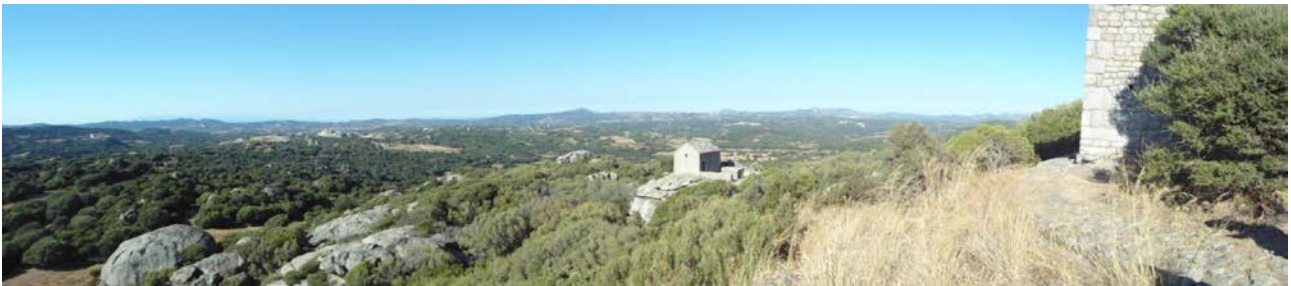
Fig. 1 - Panoramica dell'area di Balaiana: a destra il castello, centralmente la chiesa di San Leonardo.

A tre km in linea d'aria dal palazzo di Baldu svetta il castello di Balaiana collegato da un sentiero alla chiesa di San Leonardo, posta poche decine di metri a Nord (fig. 1) 1 .