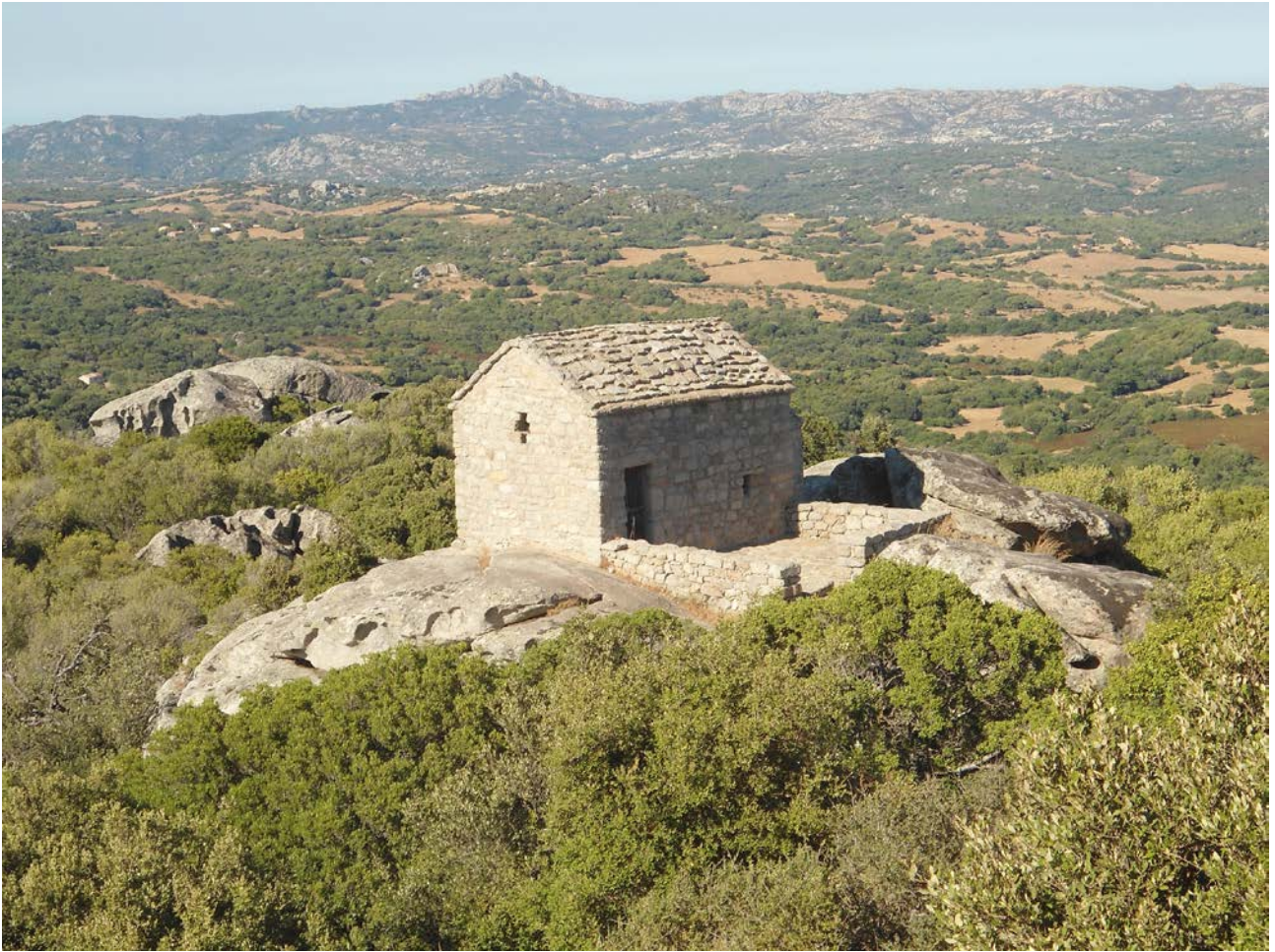
Fig. 2 - La chiesa di San Leonardo di Balaiana.

Con ogni probabilità fu la cappella del castello 4 : la struttura ad aula unica di piccole dimensioni è costituita unicamente da conci granitici, presenta l'accesso sul lato meridionale, l'abside orientata ad Est ed un avancorpo rettangolare addossato sul lato Ovest dell'edificio (fig. 3); internamente è voltata a botte e coperta da tetto spiovente in scaglie della roccia locale. La luce e l'aria all'interno della chiesa venivano fornite da una finestra dalla forma a croce in facciata e da tre monofore rettangolari, rispettivamente sull'abside (fig. 4) e sui lati lunghi 5 .