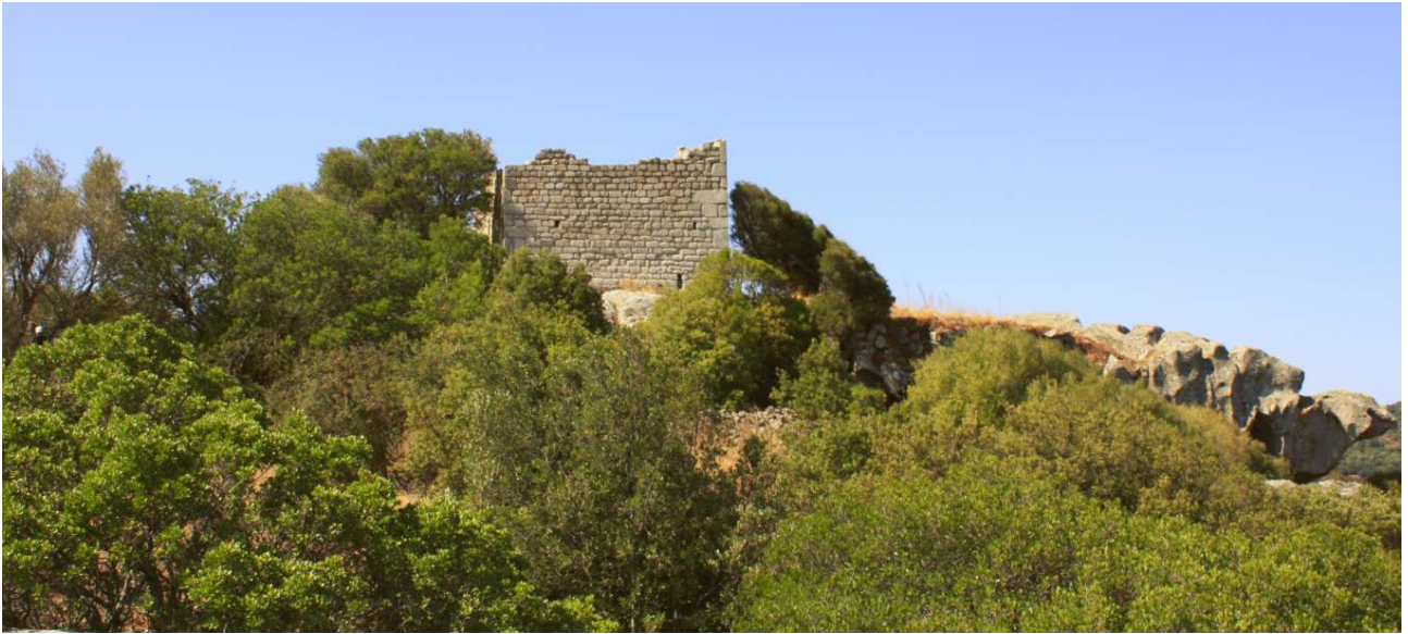
Fig. 4 - Luogosanto, Castello di Balaiana: veduta da Nord.