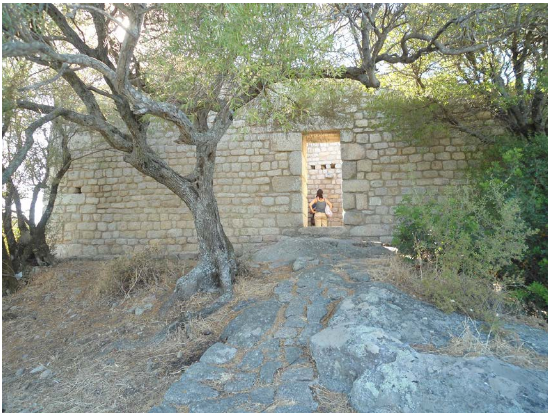
Fig. 3 - Luogosanto, castello di Balaiana, lato Est.