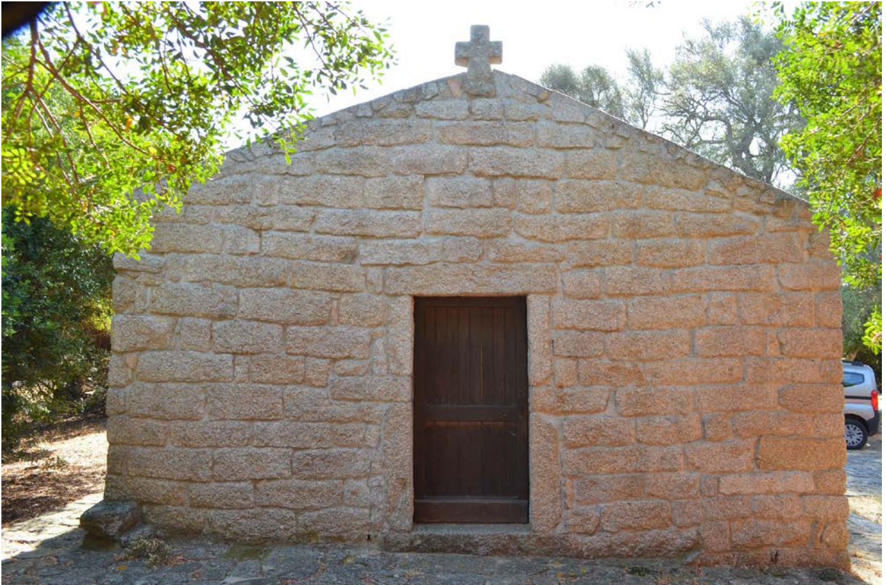
Fig. 5 - Facciata della chiesa di Santo Stefano.

La chiesa è ancora officiata in occasione della festa dedicata al Santo, che si svolge nella seconda domenica di maggio 8 .