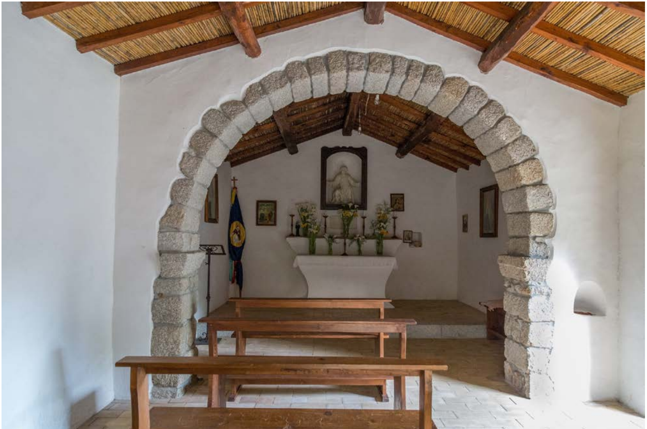
Fig. 2 - Luogosanto, Chiesa di Santo Stefano: interno (foto di Unicity S.p.A.).

La struttura è costituita in granito - pietra locale per eccellenza - con un arco a dividere internamente la navata; alla parete orientale si addossa l'altare in muratura e al di sopra, si apre una nicchia in cui trova collocazione la statua di culto in marmo 3 (fig. 2).