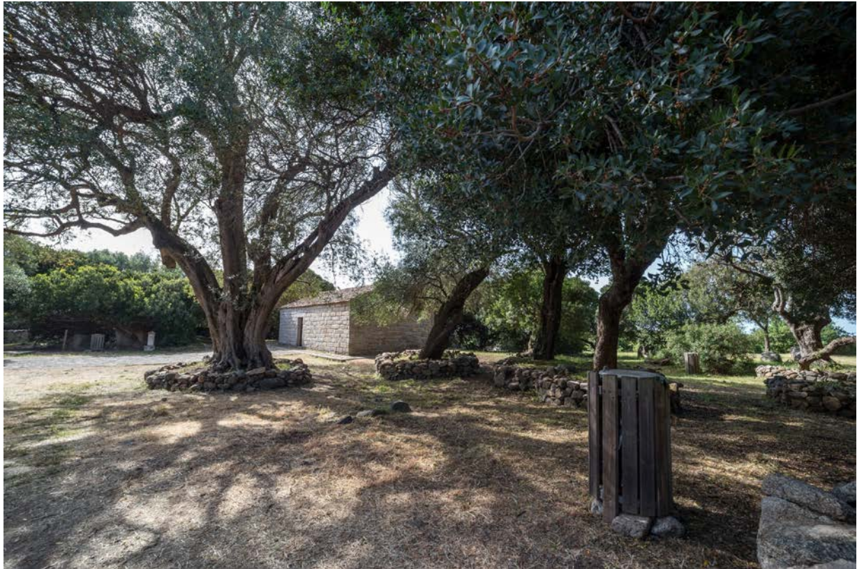
Fig. 3 - Chiesa di S. Stefano.

Lo spopolamento della villa si pone alla fine del XIV secolo, stando a quanto affermato dal sovrano Alfonso V d'Aragona nell'atto del 1421 con cui infeudava a Rambaldo de Corbaria 5 alcune terre - tra cui quelle della villa di Sent Steva - che da circa cinquant'anni risultavano disabitate 6 . Tale dato sembra non coincidere con le testimonianze archeologiche, in quanto i reperti rinvenuti durante le campagne di scavo nel sito, attestano almeno una frequentazione - se non una continuità di vita - sino al XV secolo.