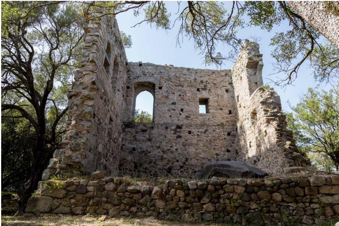
Fig. 2 - Palazzo di Baldu, veduta da Sud-Est.

Il livello inferiore della torre, esternamente dotato di un basamento a scarpa, è occupato da un grande masso, la cui funzione non è stata chiarita ma si ipotizza che fosse funzionale all'appoggio di qualche struttura e che lo spazio circostante fosse utilizzato come magazzino: sarebbero compatibili le aperture nella muratura orientate verso il cortile, forse proprio funzionali all'aerazione del deposito e delle merci ivi conservate.