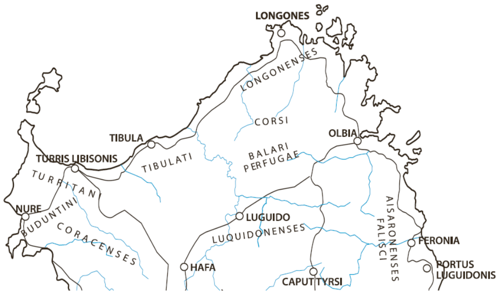
Fig. 2 - I popoli non urbanizzati della Sardegna (da Mastino 2005 p. 307, fig. 35).

secolo a.C. affermava che tutti i Sardi fossero stati sottomessi dai Cartaginesi all'infuori degli Iliensi 5 e dei Corsi (fig. 2) 6 .