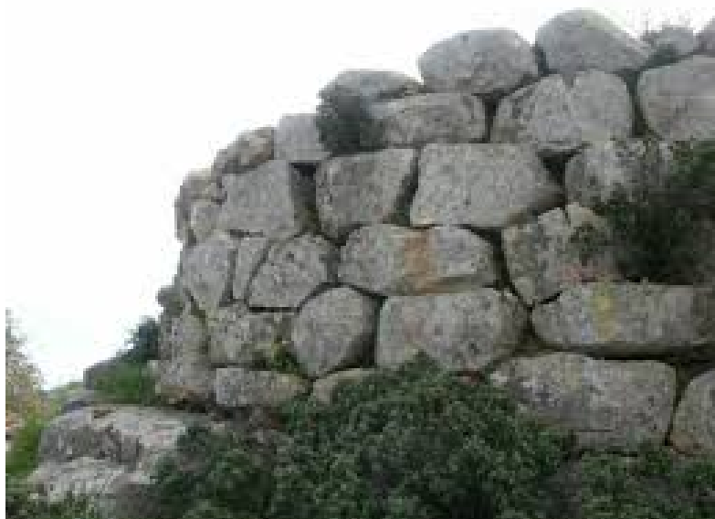
Fig. 1 - Nuraghe su Monte Ruju.