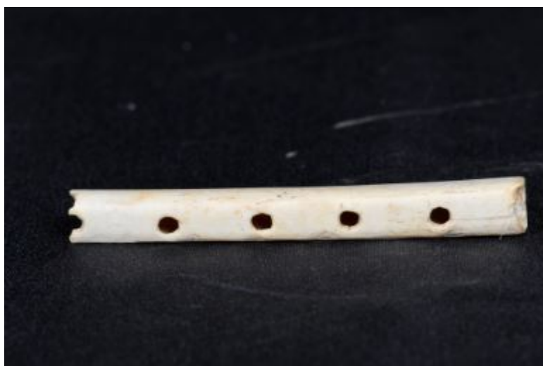
Fig. 1 - Frammento di flauto in osso dal castello di Monreale.

Fra questi materiali riveste particolare interesse un flauto in osso (non completo), che potrebbe essere indizio dell'esistenza di un contesto regale nel castello, considerata la probabile presenza di musicisti (fig. 1).