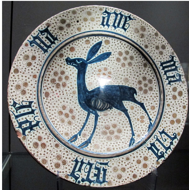
Fig. 3 - Esempio di bacile della "serie dell'Ave Maria", Manises ( http://commons.wikimedia.org/wiki/File:Manises,_bacile_con_cerbiatto_e_iscrizione_ave_maria_gratia_plena,_1400-1450_ca..JPG ).

Il manufatto per tipologia morfologica e decorativa è databile alla prima metà del XV secolo ed è attribuibile ai laboratori ceramici di Manises (comune spagnolo situato a pochi chilometri da Valencia).