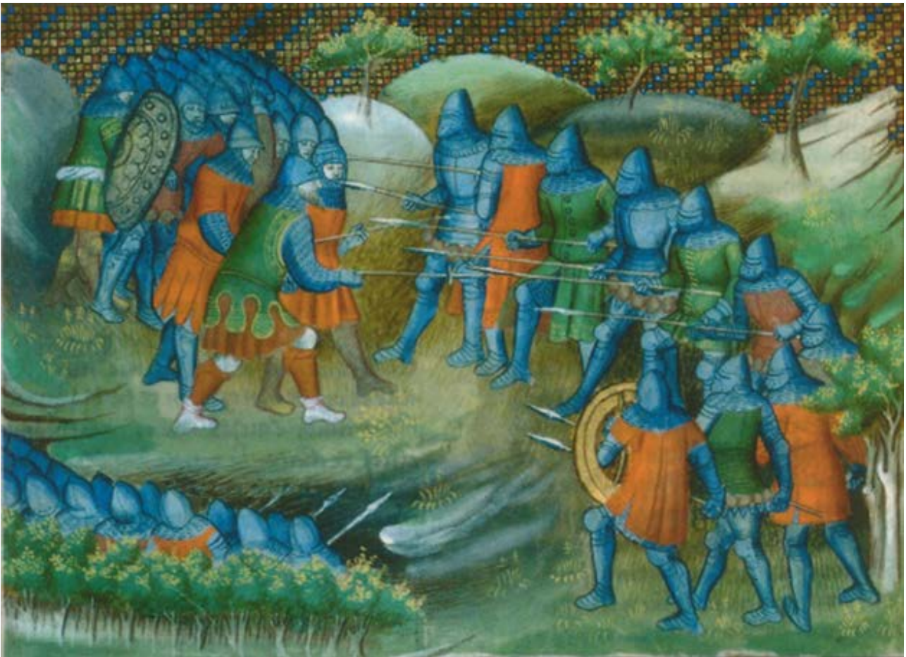
Fig. 1 - Uomini in arme (da ARMANGUÈ I HERRERO 2007, copertina).

La difesa del castello era assicurata da un contingente di armati, chiamato “guarnigione”, che abitava stabilmente nel fortilizio (fig. 1). Il numero dei componenti del presidio non era numeroso e anche in caso di guerra gli effettivi si contavano più spesso a decine che a centinaia. Oltre alla difesa del castello e dei suoi occupanti, i soldati dovevano garantire le scorte ai mercanti, soprattutto nelle zone maggiormente esposte agli attacchi dei briganti 1 . La loro presenza all’interno del maniero implicava, inoltre, l’esistenza di ambienti adibiti ad alloggi, stalle e depositi per le armi.