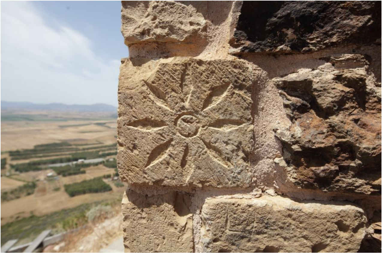
Fig. 2 - Elemento decorativo inserito nella muratura del mastio.