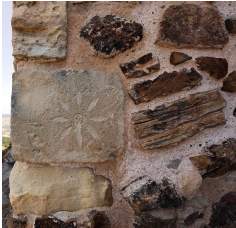
Fig. 3 - Elemento decorativo inserito nella muratura del mastio.