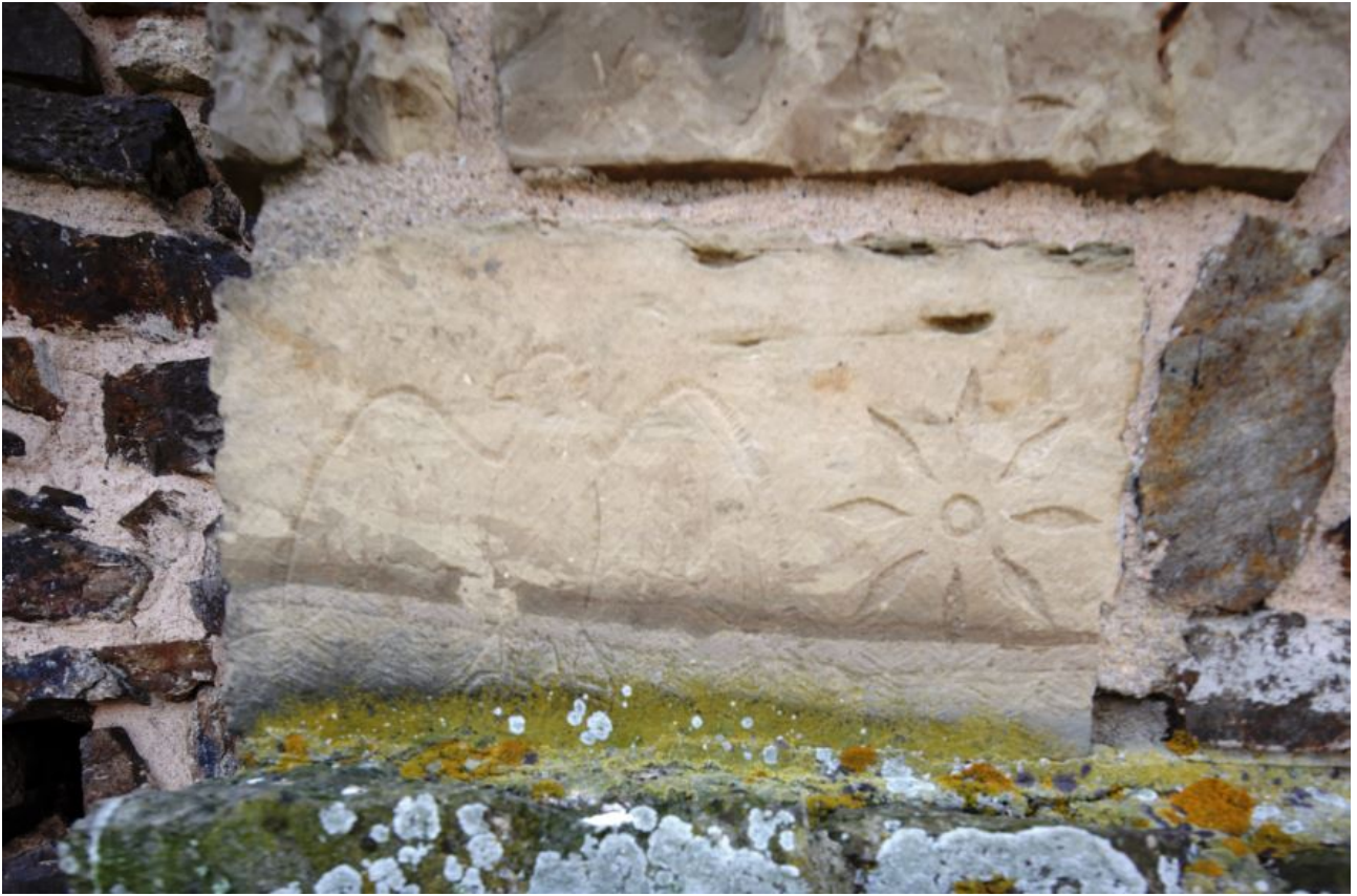
Fig. 4 - Blocco con elementi decorativi inserito nella muratura del mastio.