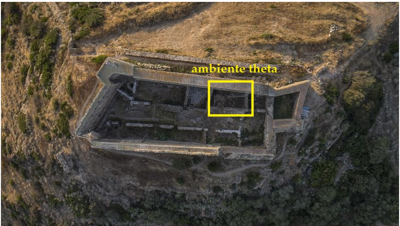
Fig. 1 - L'ambiente theta all'interno del mastio di Monreale (foto di Unicity S.p.A.).

L'indagine archeologica effettuata all'interno dell'ambiente theta (fig. 1) ha consentito di individuare un grande piano di cottura, la cui sequenza stratigrafica dimostra che questo ambiente-cucina fu utilizzato per un lungo arco cronologico, producendo l'enorme accumulo di scarti ritrovati nel vicino ambiente iota 1 .