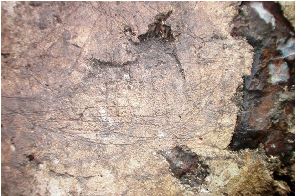
Fig. 3 - Il graffito raffigurante la caravella (foto di R. Bordicchia).