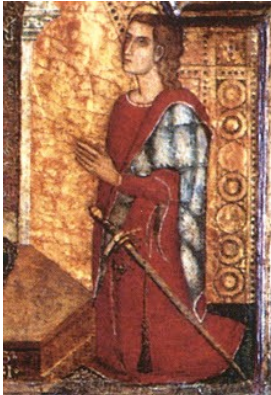
Fig. 2 - Mariano IV, particolare del Polittico della chiesa di S. Nicola di Ottana (da ORTU 2011, copertina).

Ma mentre Eleonora mirava ad esercitare una piena sovranità all'interno dei propri territori in nome dell'antica autonomia del Giudicato, la Corona d'Aragona cercava, invece, di inserire il suo ruolo all'interno di un vincolo vassallatico.