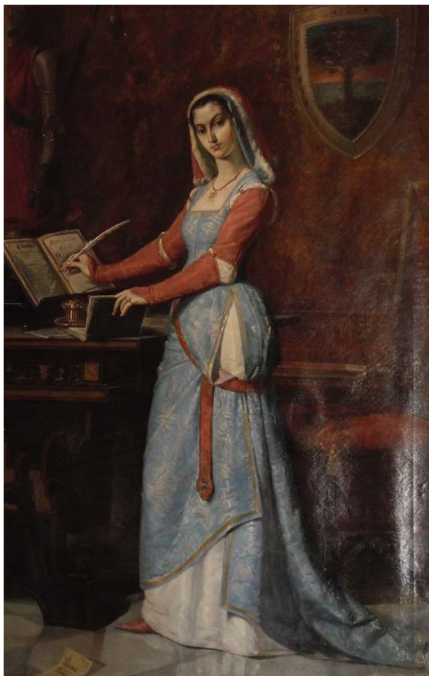
Fig. 1 - Eleonora d'Arborea firma la Carta de Logu , opera di Antonio Benini (fine XIX secolo). Oristano Palazzo Campus Colonna.

Il 17 giugno 1383, da Oristano, Eleonora indirizzò al re Pietro IV una lettera nella quale comunicava di aver sottomesso tutti i territori arborensi e affermava di aver imposto i propri diritti di successione al trono giudicale come unica figlia superstite di Mariano IV. Aveva inoltre fatto eleggere giudice, dall'assemblea della Corona de Logu , il proprio primogenito Federico e ne aveva assunto la tutela in qualità di giudicessa reggente.