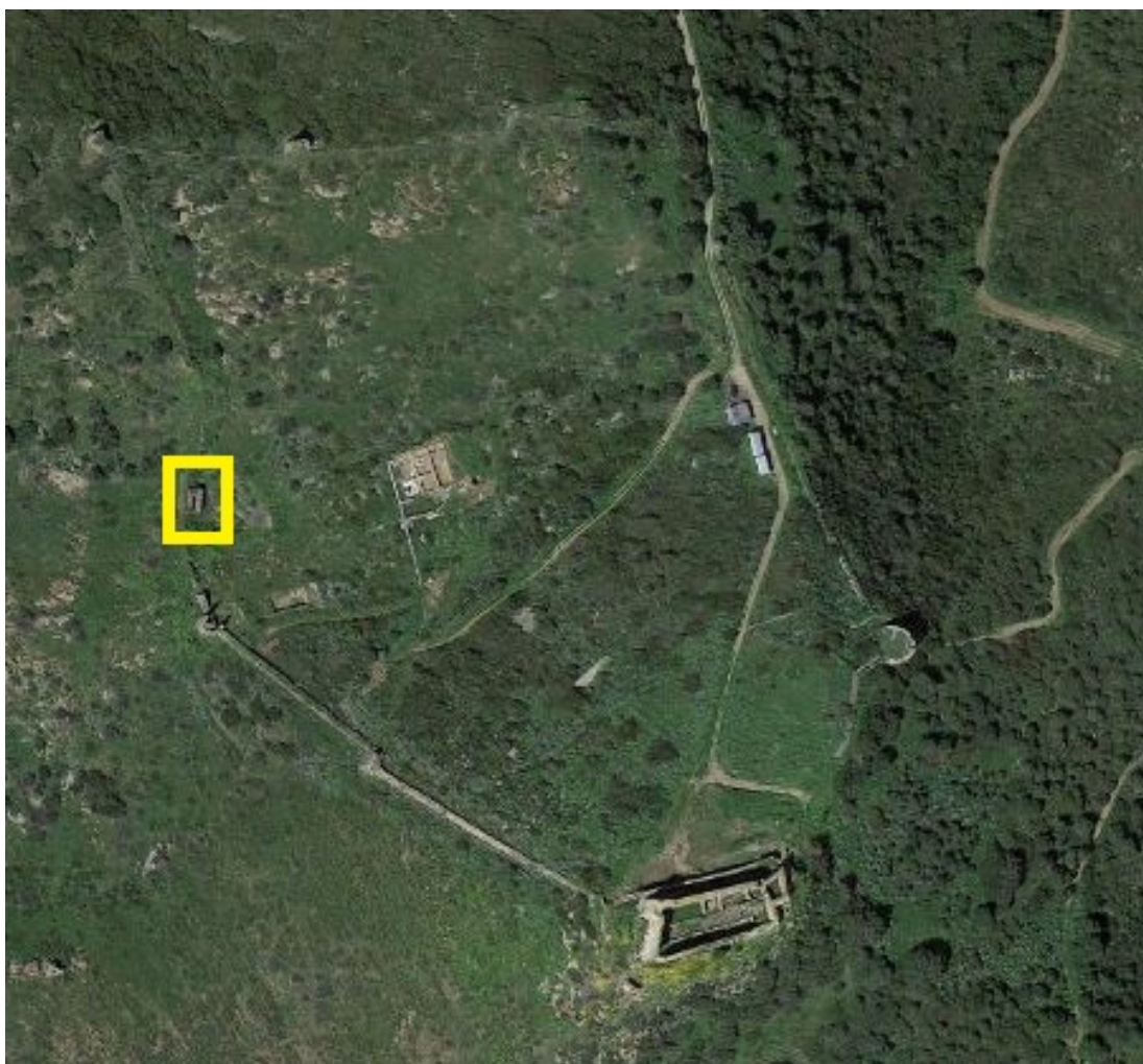
Fig. 2 - Il complesso fortificato di Monreale con l'ubicazione della struttura nota come Su Zubu (rielaborazione di M.G. Arru, da Google Earth).