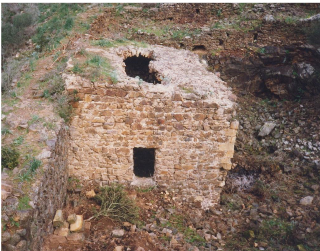
Fig. 5 - Su Zubu.