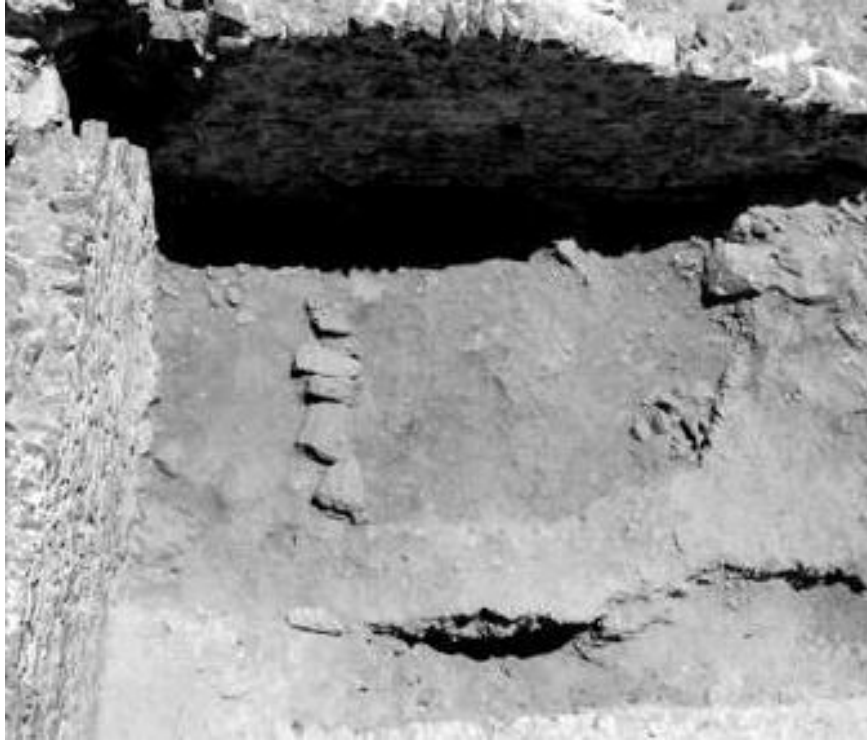
Fig. 4 - Ambiente kappa : capanna seminterrata (da STASOLLA 2010, p. 48).