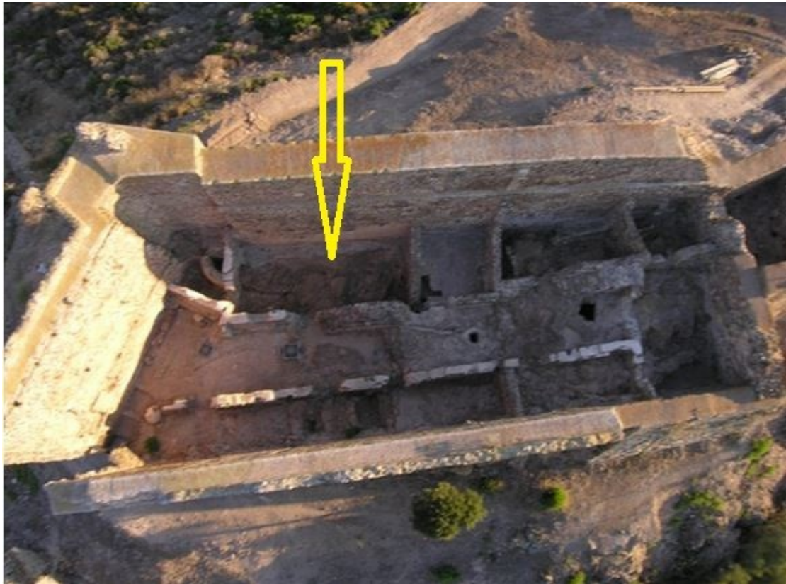
Fig. 2 - Il mastio visto dall'alto con l'indicazione dell'ambiente kappa (rielaborazione di M. G. Arru).