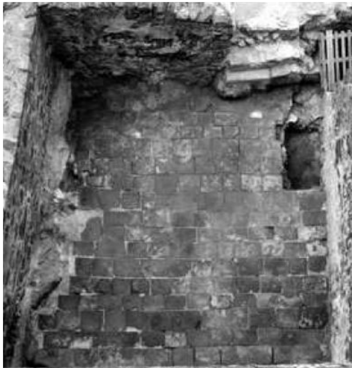
Fig. 3 - Ambiente iota ; pavimento in lastre di trachite (da STASOLLA 2010, p. 49).