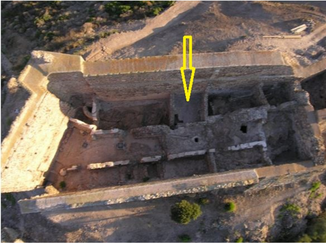
Fig. 2 - Il mastio visto dall'alto con l'indicazione dell'ambiente iota (rielaborazione di M.G. Arru).