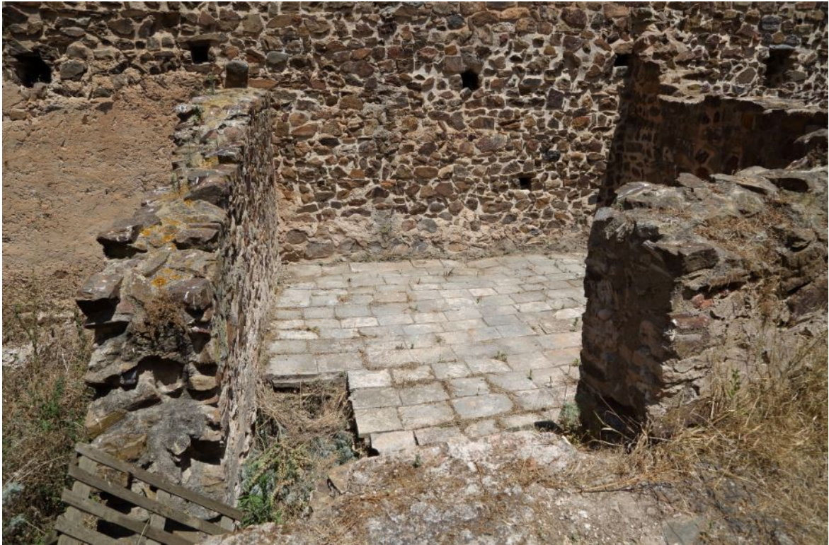
Fig. 4 - L'ambiente iota e il suo pavimento.