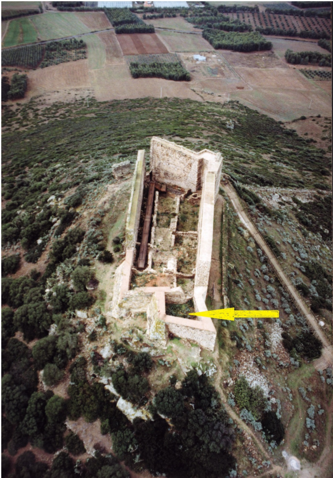
Fig. 2 - Foto aerea del mastio con indicazione dell'ambiente (rielaborazione di M. G. Arru).