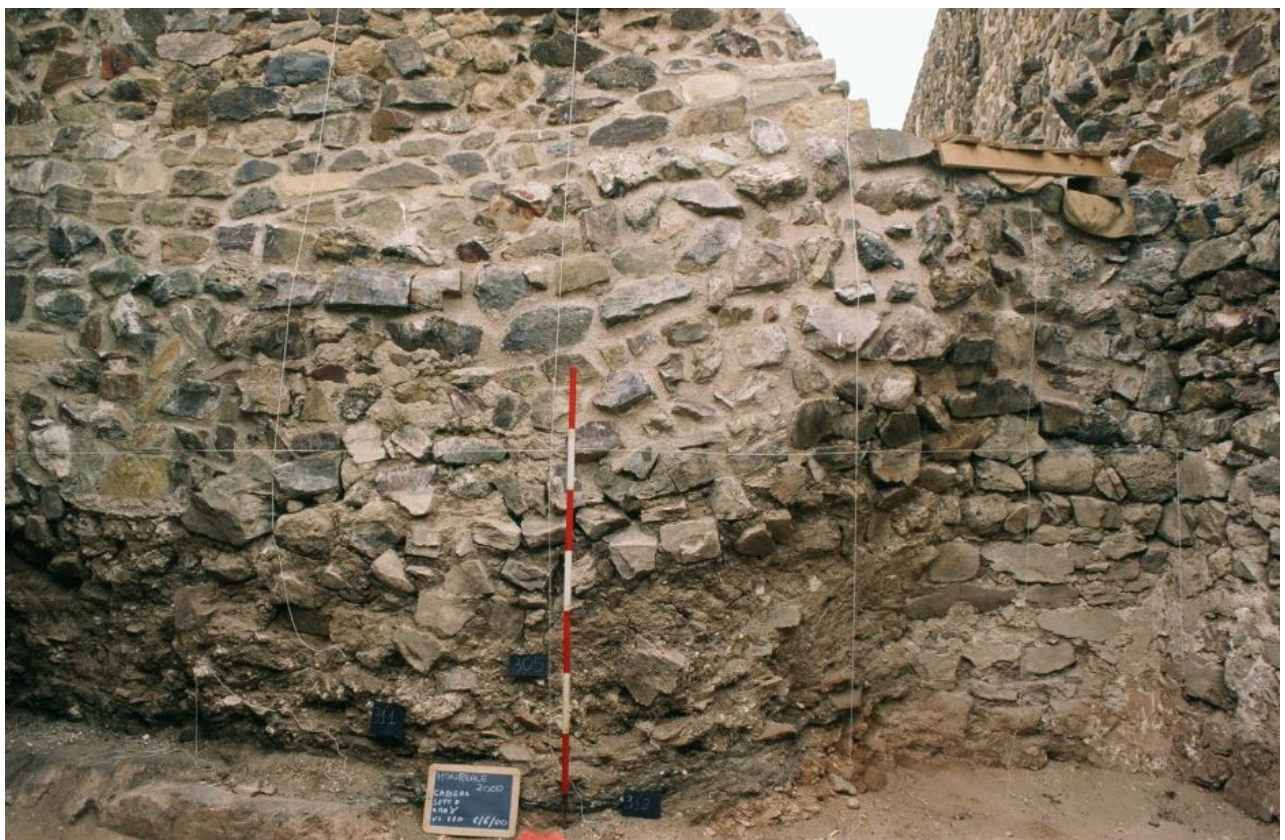
Fig. 4 - Interno dell'ambiente gamma (rielaborazione di M. G. Arru, foto di R. Bordicchia).