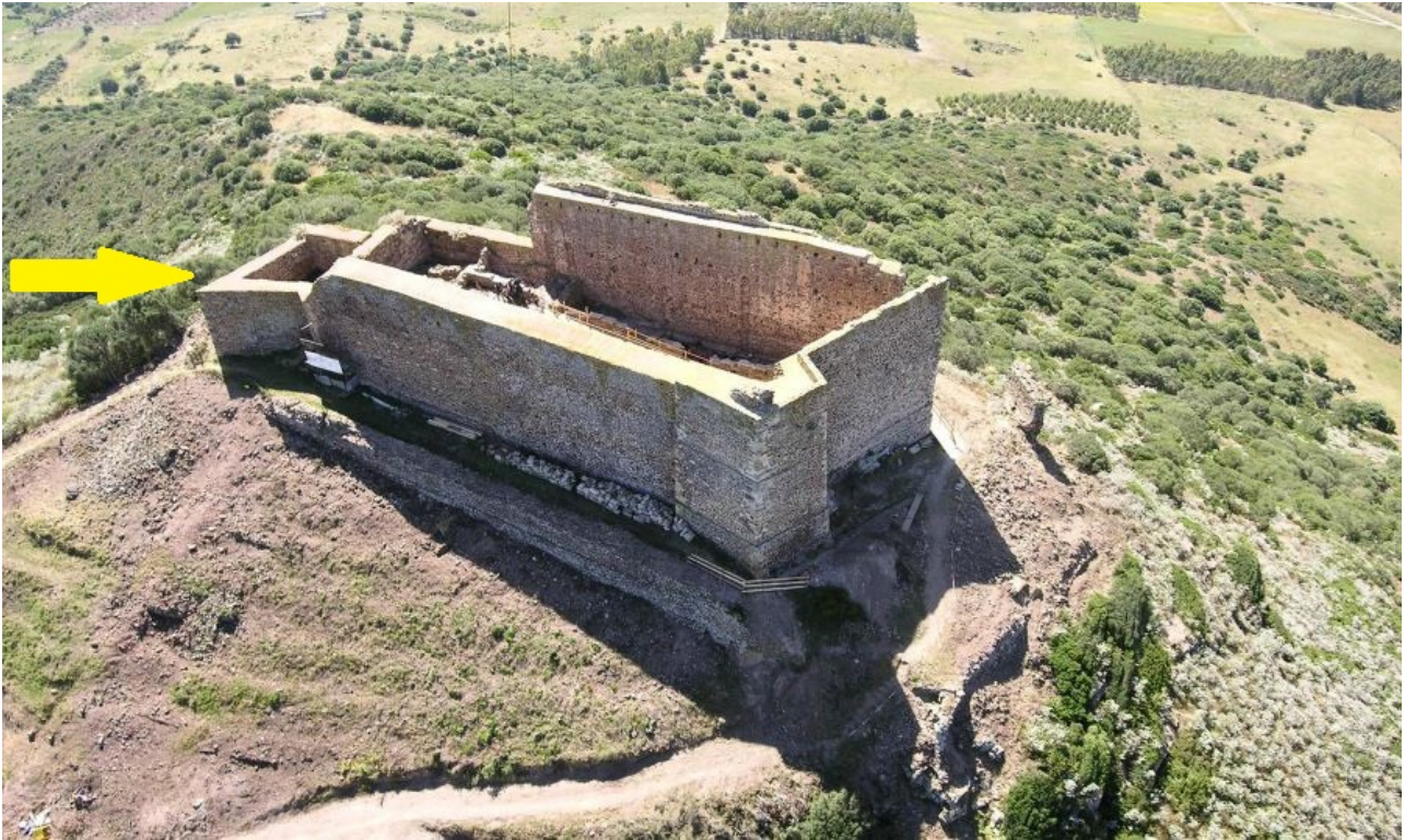
Fig. 3 - Il mastio e l'ambiente gamma visti da N-O (rielaborazione di M. G. Arru).