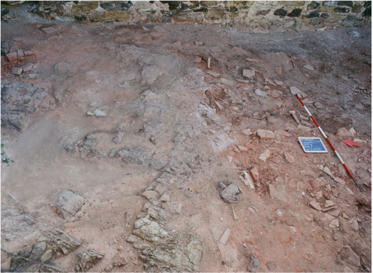
Fig. 3 - Particolare del banco roccioso affiorante all'interno del vano epsilon.