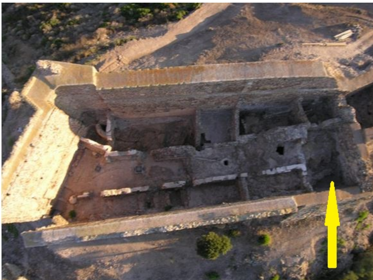
Fig. 2 - Il mastio visto dall'alto con l'indicazione dell'ambiente epsilon (rielaborazione di M. G. Arru).