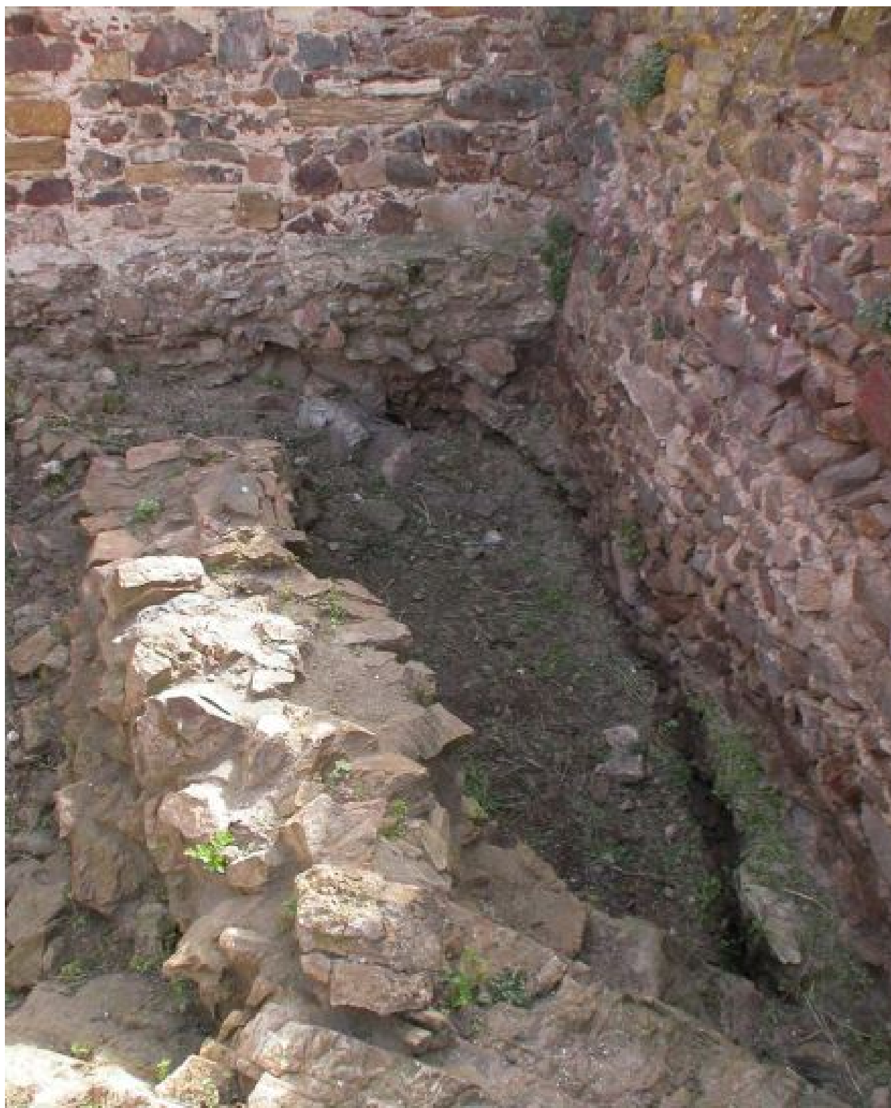
Fig. 4 - Muro curvilineo pertinente a una capanna nuragica.