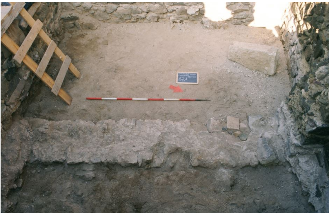
Fig. 3 - L'ambiente delta visto da Est.