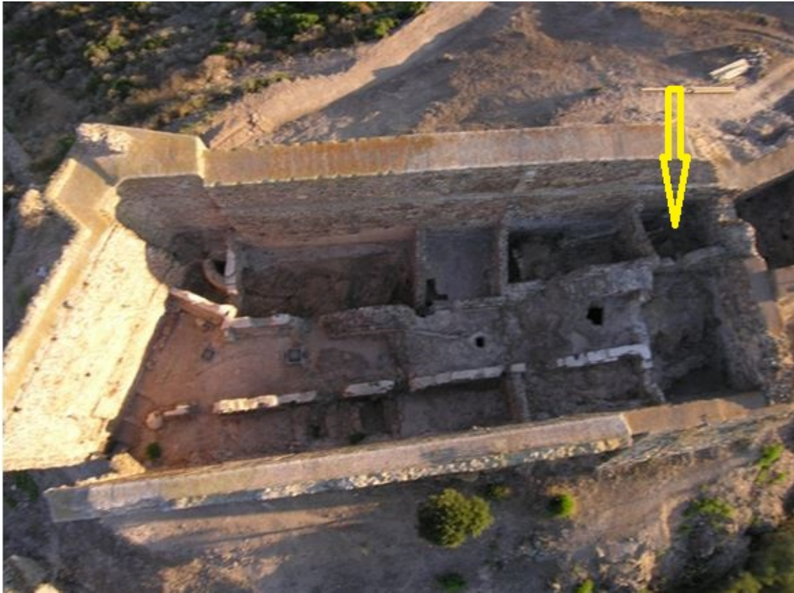
Fig. 2 - Il mastio visto dall'alto con l'indicazione dell'ambiente delta (rielaborazione di M. G. Arru).