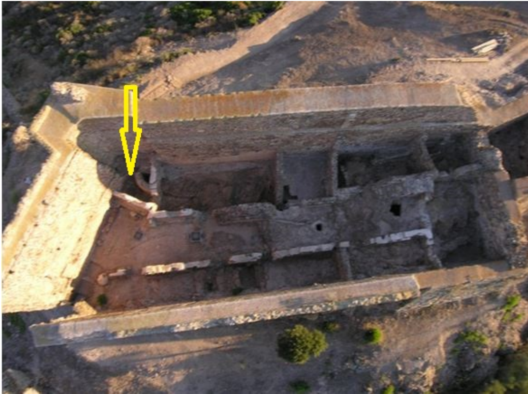
Fig. 2 - Il mastio visto dall'alto con l'indicazione dell'ambiente alpha (rielaborazione di M. G. Arru, foto di R. Bordicchia).