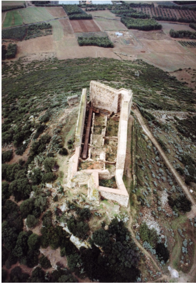
Fig. 2 - Il mastio visto dall'alto.