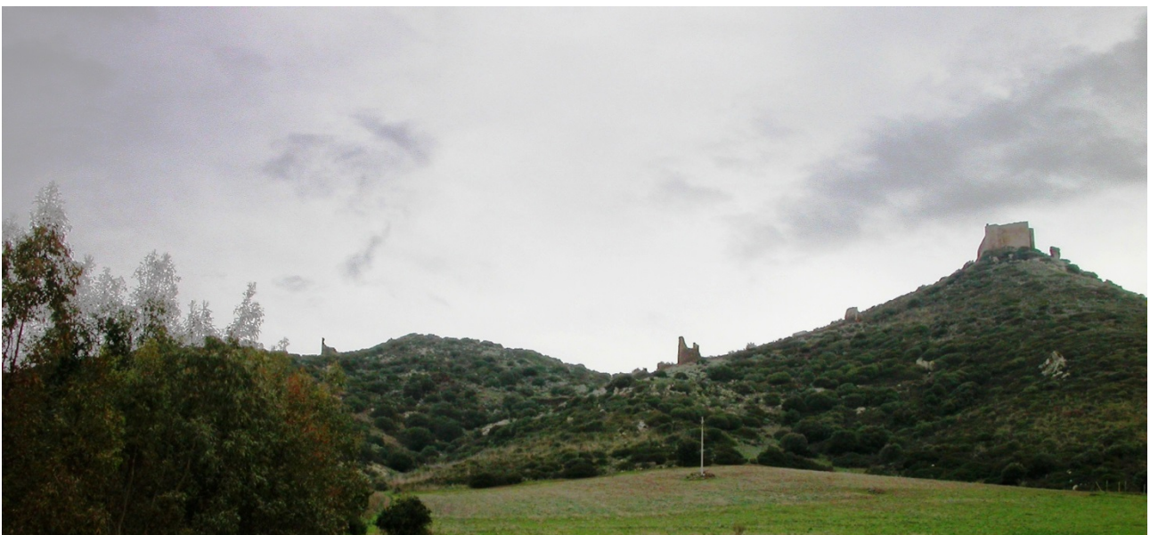
Fig. 1 - La collina e il complesso fortificato di Monreale.

Il mastio sorge in cima ad un colle dai fianchi ripidi, ad un'altezza di 387 metri sul livello del mare (fig. 1). Sono ancora ben visibili i muri perimetrali della fortezza, che si conservano per un'altezza di circa 10 metri e racchiudono una superficie interna di circa 720 metri quadrati (fig. 2). Dal punto di vista planimetrico, l'edificio ha una forma assimilabile ad un trapezio irregolare allungato, con i lati settentrionale e meridionale paralleli tra loro e quello occidentale obliquo rispetto ai primi due. L'ingresso, ricavato nell'angolo in cui si uniscono i muri perimetrali sud e ovest, immette nello spazio interno del mastio, che si articola in vari ambienti: cinque addossati al muro settentrionale, due a quello meridionale, uno sul lato sud-est, più un altro spazio interpretato come una torre sul lato nord-orientale (fig. 3). Questi vani, di cui attualmente residua solo il piano terra, si sviluppavano su più livelli, come testimoniano i fori di alloggiamento dei pavimenti lignei dei piani sovrapposti. Sulle pareti perimetrali non vi sono aperture, per cui sia gli ambienti del piano terra che quelli dei piani superiori venivano illuminati esclusivamente dalle finestre che si aprivano sul cortile interno. L'edificio risulta costruito con un'opera muraria irregolare, realizzata con pietrame di scisto locale, trachite, granito e calcare, il tutto legato da abbondante malta.