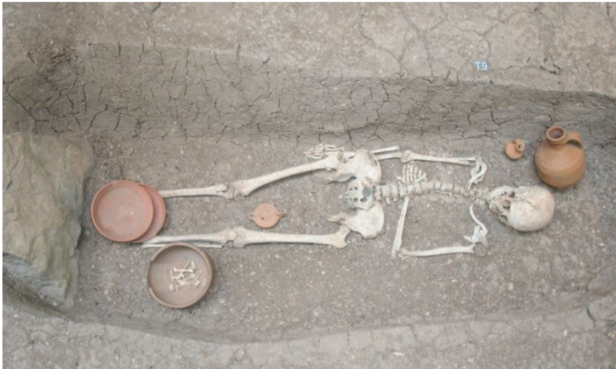
Fig. 3 - Ricostruzione di una delle tombe della necropoli di Terr'e Cresia.